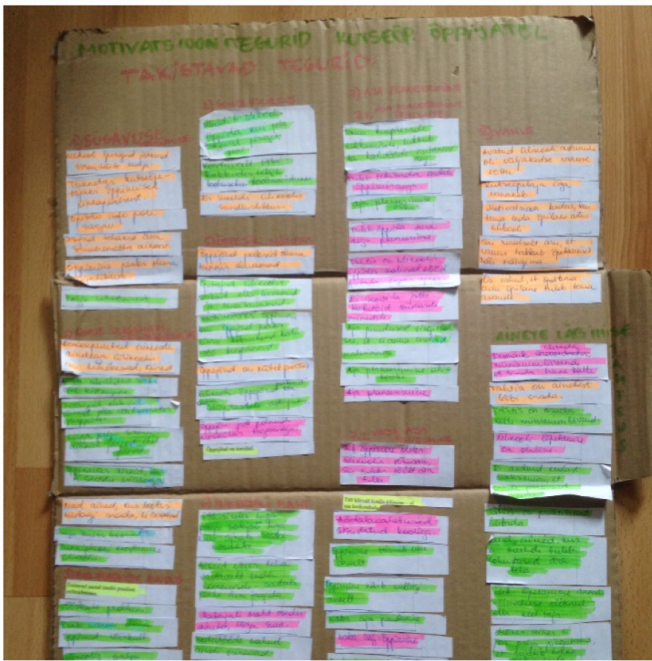
Lisa 4. Foto grupeeritud kategooriatest.