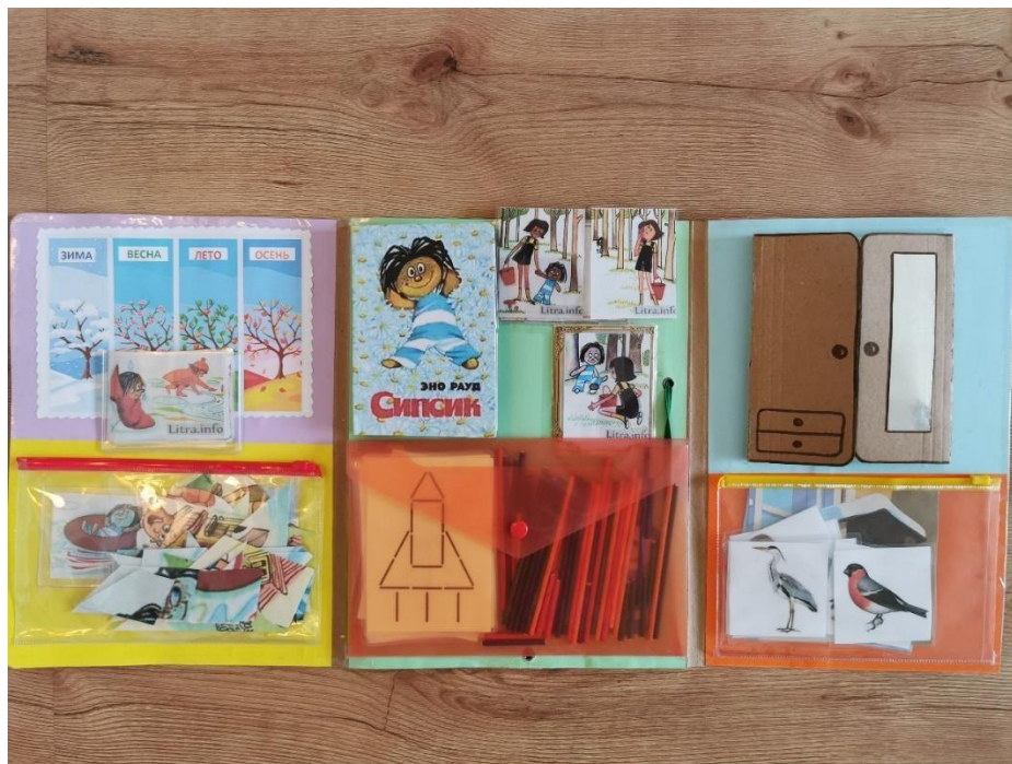
Тыльная сторона лэпбука.