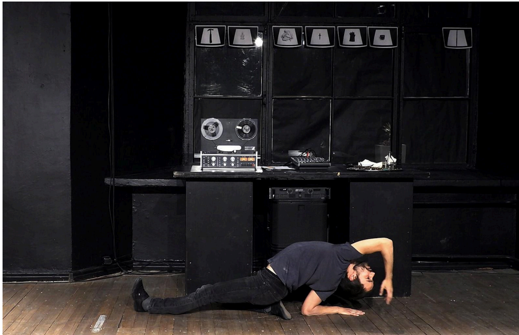
Lavastus „Seisund ja disain”.

ainult asjad, vaid ühtlasi ka asitõendid” (Orav 2017). Esemete rituaalne käsitus viitas arhiivile, mälu materiaalsusele ja heli kui dokumendi usaldatavusele.