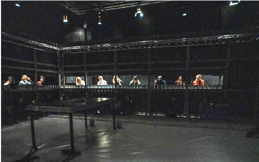
„Ma jään kaevu \ juurde igavesti jooma” Tartu Uues Teatris.

Nii toimib lavakujundus poeetilise aegruumi vahendajana. See kehastab Mihkelsoni luulele omast eraldatuse ja suletuse kogemust – olukorda, kus nähtavus ja kohalolu on alati osaline, katkestatud ja puudulik, asetudes Luksi (2021) kirjeldatud „radikaalse kodutuse” atmosfääri.