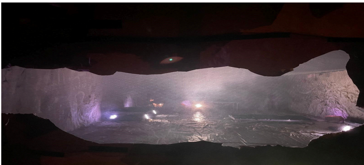
Helikujundaja vaate- ja kuuldepunkt lavastuses „traps” (prooviprotsessi aegne foto)

Helikujunduse tööprotsessis muutus kogu see kogemuste summa (välised sündmused, meediakujundid ja teatriruumi füüsiline kohalolu) justkui mobilisatsiooniks – seisundiks, kus kogu keha ja tajuline aparaat oli pidevalt valmisolekus reageerima. Reaalsajas toimuv helitöö nõudis täielikku kohalolu, milles afektiivne seisund oli sama oluline kui tehniline oskus. Seeläbi oli helikujundus pigem vastus kui plaan, pigem reaktsioon kui kompositsioon.