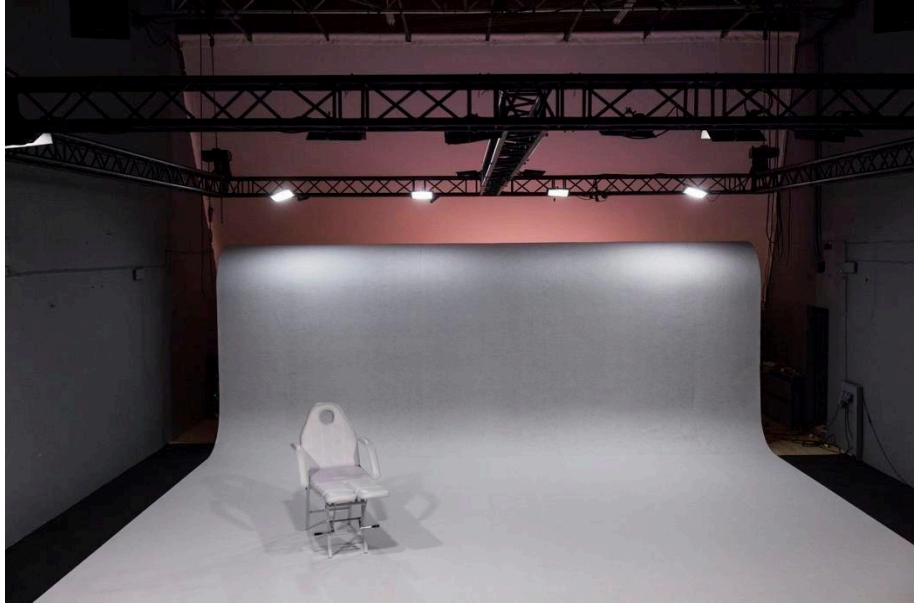
Lavastuse „Planet Alexithymia” avamängu (a stseen) visuaalne vaade.

b) Avamängule järgnes kõlaritest kõlav käsklus: „Kuula nüüd seda”, millele omakorda järgnes valguse hämardumine ja vaikselt kuuldav siinuslainepõhine morsesignaal, rõhutades subliminaalse 12 signaali kvaliteeti. Kui avamängu helimaailm oli pidev, ruumiline ja akustiliselt avatud, siis avamängu järel kõlanud käsklused ja morsesignaal mõjusid vahelduvalt, suletult ja suunavalt – luues kontrasti valjuse, rütmi ja helikaracteri tasandil. Sarnased verbaalsed korraldused – „Kuula veel”, „Vaata nüüd” – kordusid kogu lavastuse jooksul, kehtestades kõlarihääle kui anonüümse juhendaja, kes osutab vaataja kuulamise ja vaatamise protseduuridele ning sekkub otseselt tema närvisüsteemi talitlusse.