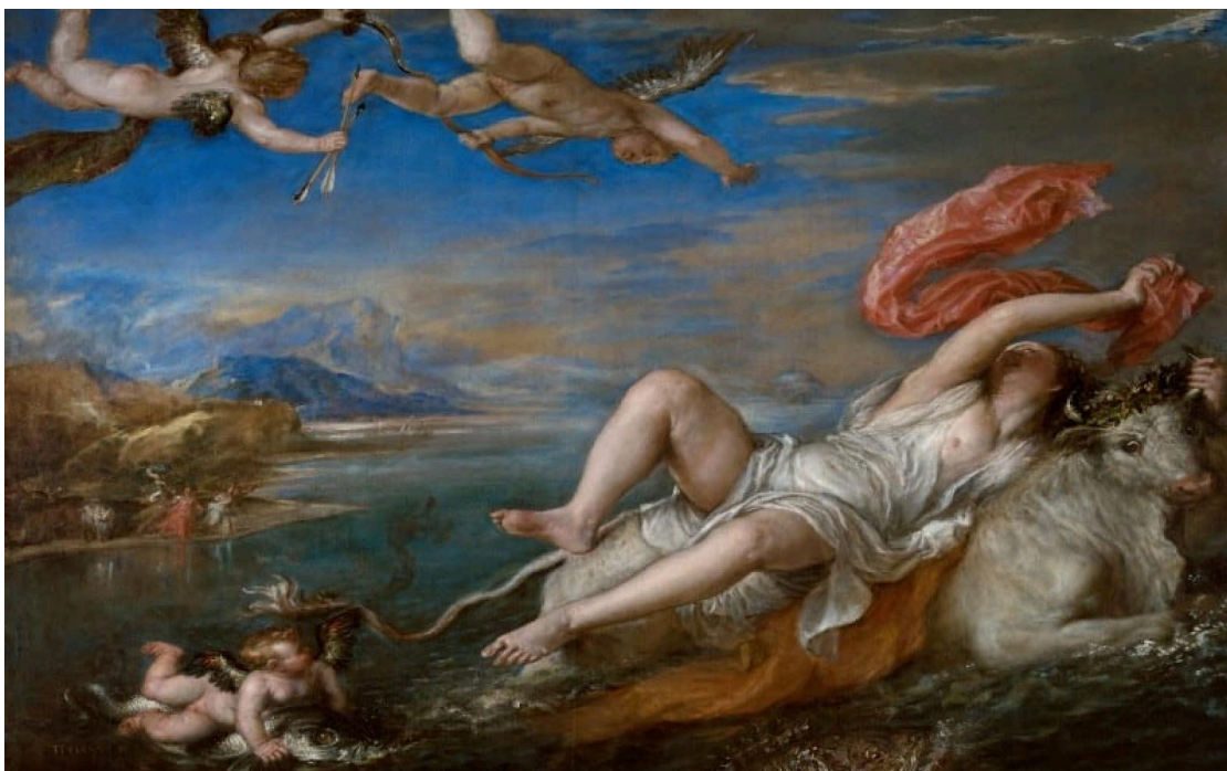
Tiziano Vecellio maal „Ratto di Europa” (1562).

Te näete horisontaalset, peaaegu ruudukujulist massiivset õlimaali lõuendil, umbes 1,8 meetrit lai ja 2 meetrit kõrge. Kunstnik kujutab stseeni Ovidiuse „Metamorfoosidest”, kus Jupiter, jumalate kuningas, on Europesse kiindunud, muudab end härjaks ja röövib naise. See maal jäädvustab hetke, mil Europe ronib meres härja selga, kaugel on rannik ja mäed.