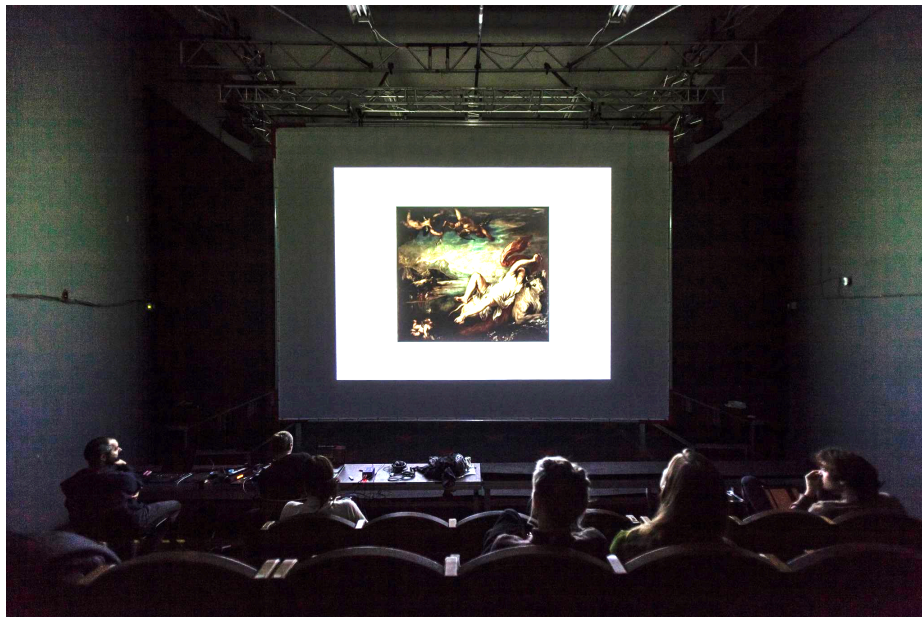
„Schema” A-osa seadistus, prooviprotsess.

Lavastus koosneb kahest osast. A-osa on 25-minutiline videoprojektsioon, mida näidatakse publiku ja lavaala piirile paigutatud suurele (7 × 5 meetrit) valgele ekraanile. Publik istub saali tavapärasel istekohtadel, ekraan aga eraldab lavaruumi ja publikuala. Helisüsteem on üles ehitatud kahel tasandil: publiku kohale lae alla on paigutatud kaks aktiivkõlarit, mis edastavad üldist helipilti. Lisaks on lavale, ekraani taha, statiivile paigutatud kolmas kõlar, mille eesmärk on toetada videos kõlavaid hääli. See loob keskse akustilise tugipunkti, mis „maandab” hääle ja hoiab selle selgena ja fokuseerituna, vältides selle hajumist Kanuti Gildi saali lae alla.