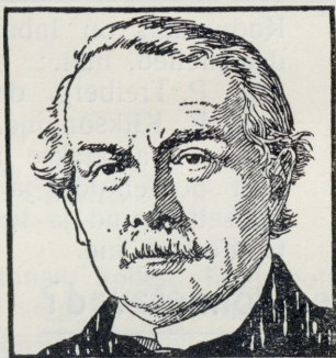
Inglise peaminister Lloyd George.

Huvitavalt mitte ainult eriteadlastele, vaid kõigile neile, keda huvitavad suured maailmaelu probleemid ja kes teid tahavad leida ja otsida parema tuleviku poole tänapäeva raskuste ja veriste sõdade rägastikust.