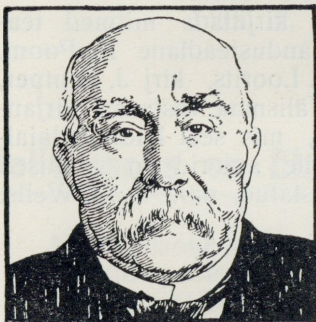
Prantsuse peaminister Clémenceau.

Hoolimata sellest, et säärane aine nagu suur maailmasõda on lõpmata korrutatud ja tühjakspumbatud, on Wellsi raamat kirjutatud äärmiselt huvitavalt.