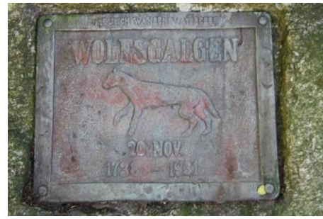
Joonis 6. Moto „Treulich während Väter Erbe“. Schortensi kodulooourijate seltsi logol (vasakul) 22 ja sama moto Schortensi hundikivil asuval tahvlil (paremal) 23

Kivil olev kiri „ustavalt hoides esiisade tarkust“ toob meelde sama teema ühest tšehhi dokumentaalifilmist „Hundid tulevad“ aastast 2021, kus kujutati olukorda, kus hundid jõudsid samuti ühte piirkonda üle 250 aasta hiljem ning sealsed elanikud arvasid, et nüüd on nende esiisade tarkusele vesi peale tõmmatud. Nad väljendasid seda mõtet filmikaamera ees nõnda: “Me loodame end kaitsta selle ideoloogia eest, mis ei austa meie esiisade õppetunde[...]Kas te arvate, et meie esivanemad olid lollid, et hundid kolmesaja aasta eest ära hävitasid?” (vt Arusoo 2020).