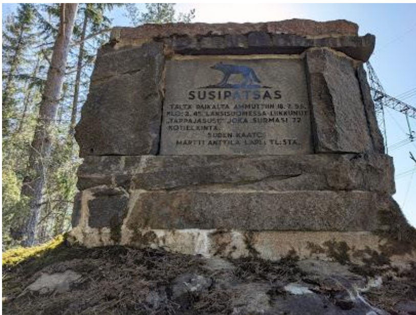
Joonis 1. Soome hundikivi viimasele võsavillemile aastast 1956. 4

Hundikivi on lisaks ka omalaadne hübriid triumfeerivast mälestusmärgist ja lahingupaiga tähistajast. Ühest küljest on kivi pühendatud „vaenlase“ ehk hundi kahjutuks tegemisele – sellele viitab hundikujutis kivil ja surmamise kuupäev; teiseks on see oluline kui lahingupaiga tähistaja, millele viitab kivi asukohapõhisus – kivi on teadaolevalt alati püütud paigaldada samasse kohta, kus hunt tabati.