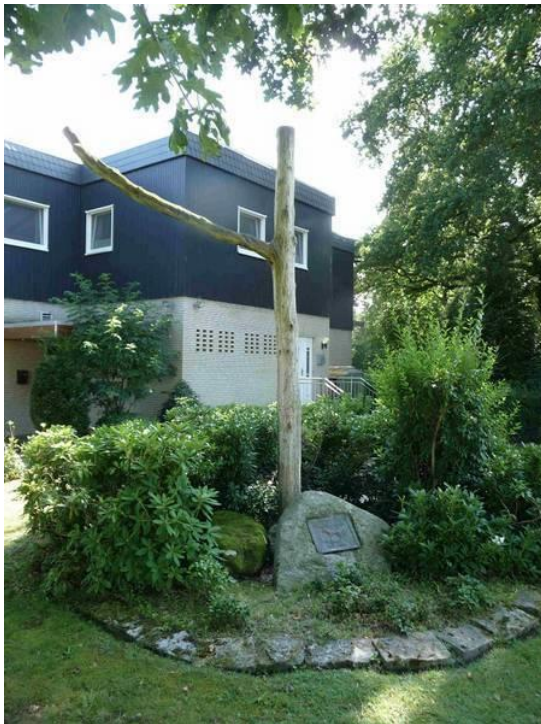
Joonis 3. Ajalooline hundikivi ja hundivõllas Schortensi linnas Alam-Saksimaal. 9

Esimene analüüsitav hundimonument asub keset Schortensi väikelinna Alam-Saksimaal ja jääb silma esmalt oma hundivõllaga – kuivanud tammepeuu üksiku rõhtsa oksaga (vaata joonist 3).