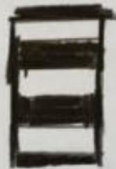
2. ülekiigum rauda