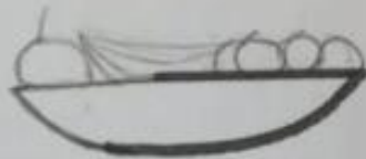
1. Puuvilja lauss

Joonista sellel ja järgmisel lehel toodud lõpetamata kujunditest huvitavaid asju ja pilde. Püüa välja mõelda midagi sellist, mille peale keegi teine sinu arvates ei tule. Mõtle igale pildile ka nimetus või pealkiri, kirjuta see pildi alla numbri järel. Sul on aega 10 minutit.