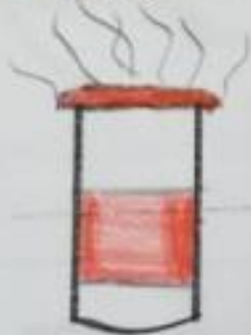
4. kuhvi tops