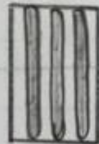
5. vaaniga trallid