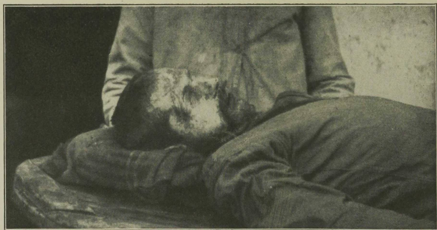
אומבאַקאַנטער, געהרגעט דורך די היידאָמאַקעס אויף סט. ראַמאַדאַן. (צוגעשיקט פון מירנאַראַדער קהלה-ראַט אין ירוּשָׁלַיִם מיניסטעריום.)