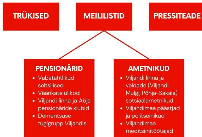
Joonis 2. Konverentsi turundus ja sihtgrupid.