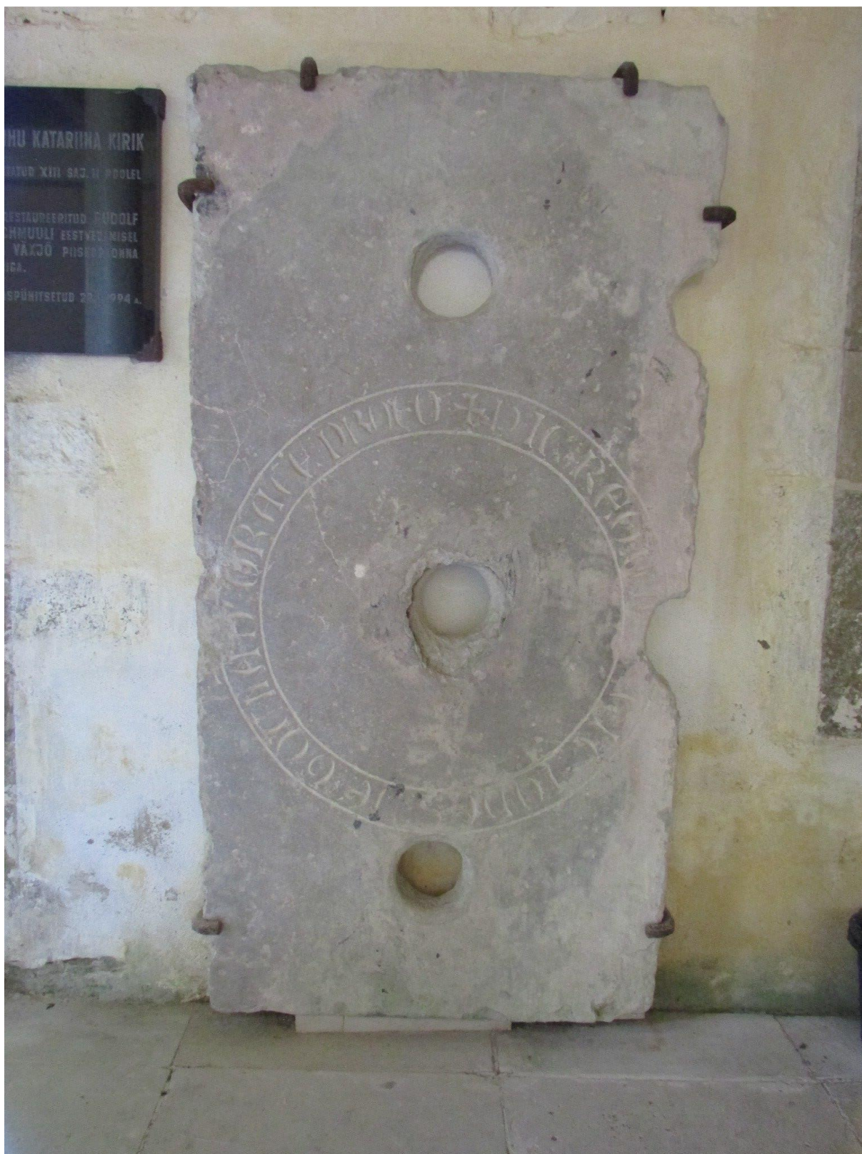
Joonis 2. Ehitusmeister Johannese hauaplaat.