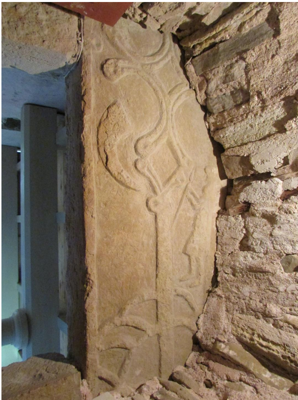
Joonis 1. Trapetsiaalne hauaplaat ilmapuu, sõdalase ja sarve kujutisega.