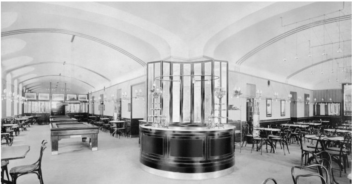
Café Museum, interjööri vaade 7

Väärrib märkimist, et Loosi Café Museum'i loodud interjööri anti hüüdnimi „Café nihilismus“. Selle interjööri puhul ei saa rääkida käsitöögildide töödele sarnasest ajastuse pürgimusest, vaid olevikulisusest. Väljendusvaesus ja ebatavaline kompositsioon muudavad selle nihilistlikuks. Laiemalt on tegu stiiliküsimusega. Stiil peaks kandma endas minevikku, tõstes selles esile igale ajastule tähtsad aspektid. Stiil kannab endas ka sisemist häälestust (sks Stimmung ). (Cacciari 1995: 110-111) Café Museum'i interjööri iseloomustab sel moel lisaks ornamendi puudumisele ka nostalgia puudumine. Stiili mõttes minevik saab selle käigus eemaldatud.