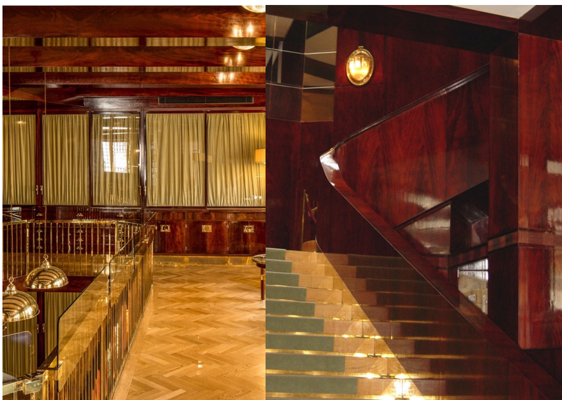
Looshaus, interjööri vaade 3,4

Näiteks vajavad erinevad väsimuse astmed endale omast viisi puhkamiseks. Loosis väljendub Ameerika poolehoid, kus tohib suisa avalikus ruumis mitteelegantselt puhata, näiteks jalgade teisele toolile või suisa lauale asetades ning pikali heites. Samas on paradoksaalsena kõlvas ebamugavuses mugavus, mis teeb näiteks just toolil aset leidnud vestlused paremaks kui tugitoolis. Viide sellele, et „ebapraktiline“ pole alati ebamugav. (Loos 1998: 64-65) Inglismaal ja Ameerikas näib Loosi arvates kehaline heaolu olevat üle trumpanud etiketi, mida mujal reeglikohaselt järgitakse. Järeldusena tõdeb Loos, et kui tehtaks ainult praktilisi toole siis võiksid inimesed ise hakkama saada interjööri kujundamisega. (Loos 1998: 66) Näib, et probleem seisneb tarbeesemete ekslikus kunstivaldkonda paigutamises, mis toob kaasa ebavajalikud kaunistused, millel aina enam paistab puuduvat autentne väärtus. Lisaks sellele on kaunistustele orienteerituses jäetud funktsionaalsuse ja mugavuse tähtsus tagaplaanile. Kui esemetel puuduvad kandvad väärtused või need on ajas hävinud, saab olukorda vaadelda nihilistlikkuse aspektist. Tunnistades väärtuste väärtusetustumist saaks liikuda olukorra ületamise poole, mis tooks kaasa uute väärtuste kehtestamise.