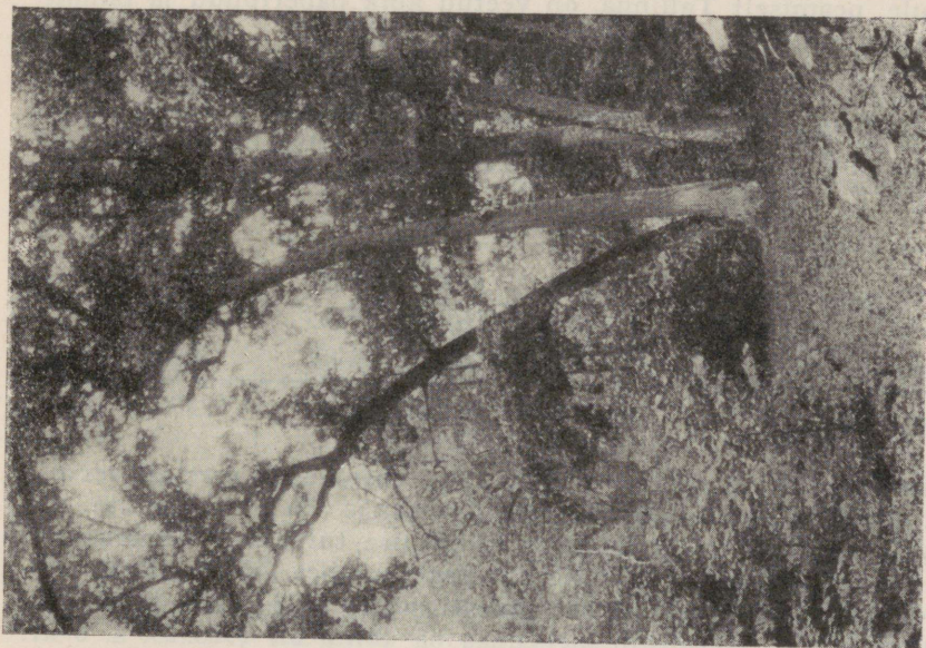
90. joonis. Tumalataammik, umb. 200 a. vana.