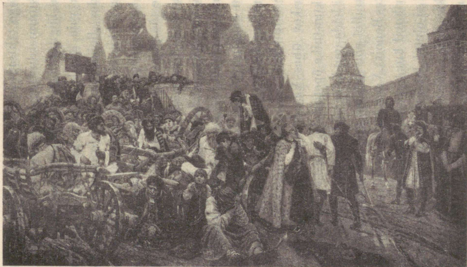
„Streletside hukkamise hommik“