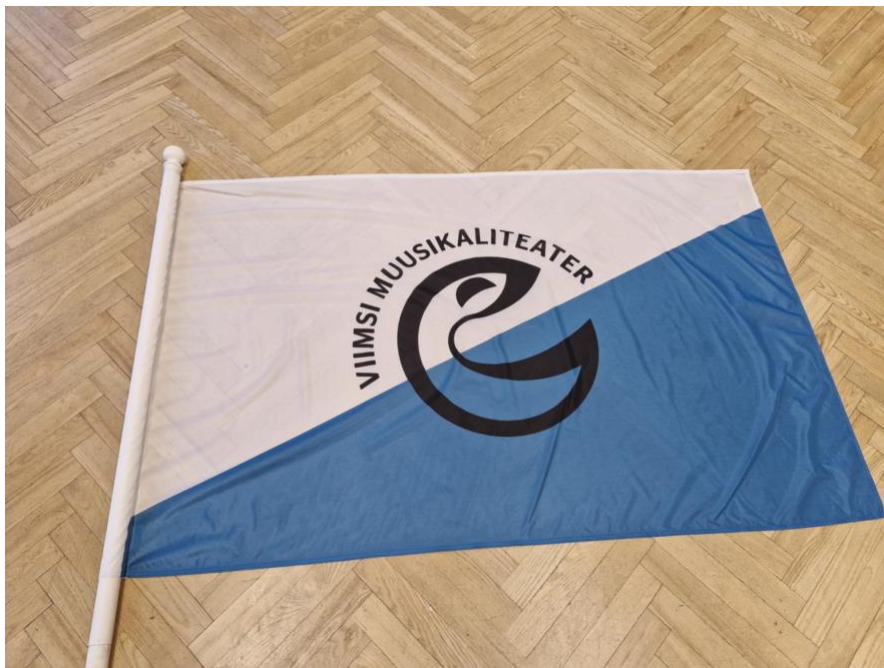
Viimsi Muusikaliteatri lipp