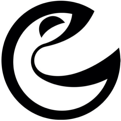
Viimsi Muusikaliteatri logo