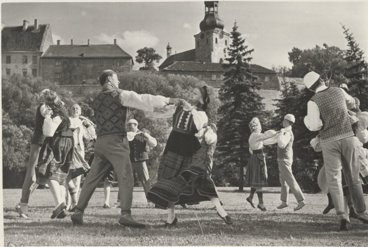
Foto 2. Tantsib Eesti NSV teeneline rahvatantsukollektiiv "Sõprus".