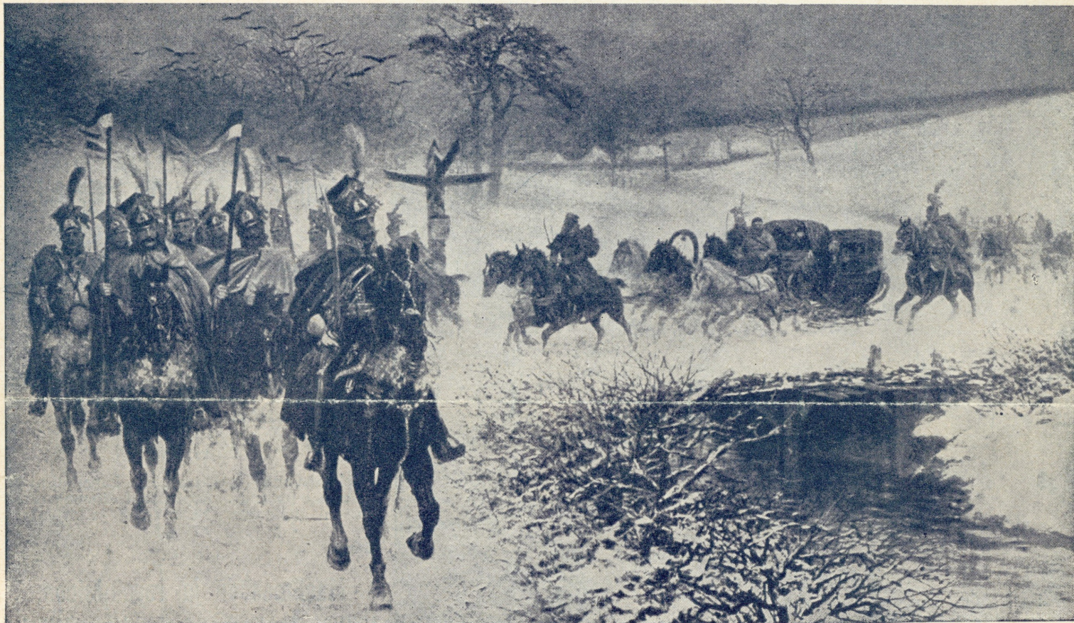
Napoleon tõttab Poola ulaanide kaitsel Venemaalt tagasi Euroopasse (V. Helmerisk'i maal.)

Iga raamatu hind tellijaile vaatamata eriti toredale väljaandele ainult Kr. 1,50.