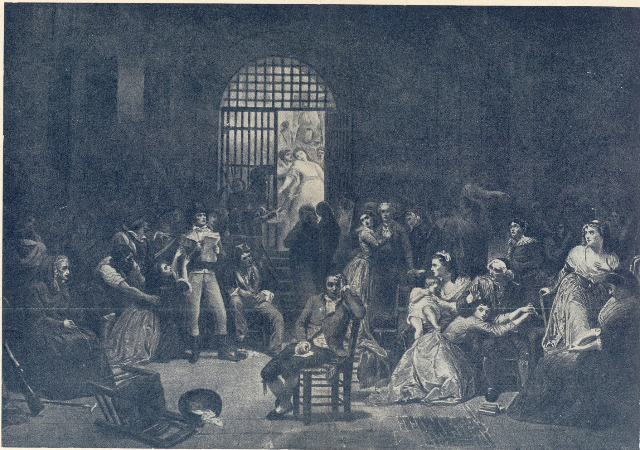
Prantsuse revolutsiooni ajast: Viimsed terrori ohvrid (Mülleri maal Versailles'i galeriis).

Maailm pärast sõda. Slik hegemonia. Aasia teliit. Paneuroopa idee. Väärtuste ümberhindamine ja fašism. Lenin ja aalid.