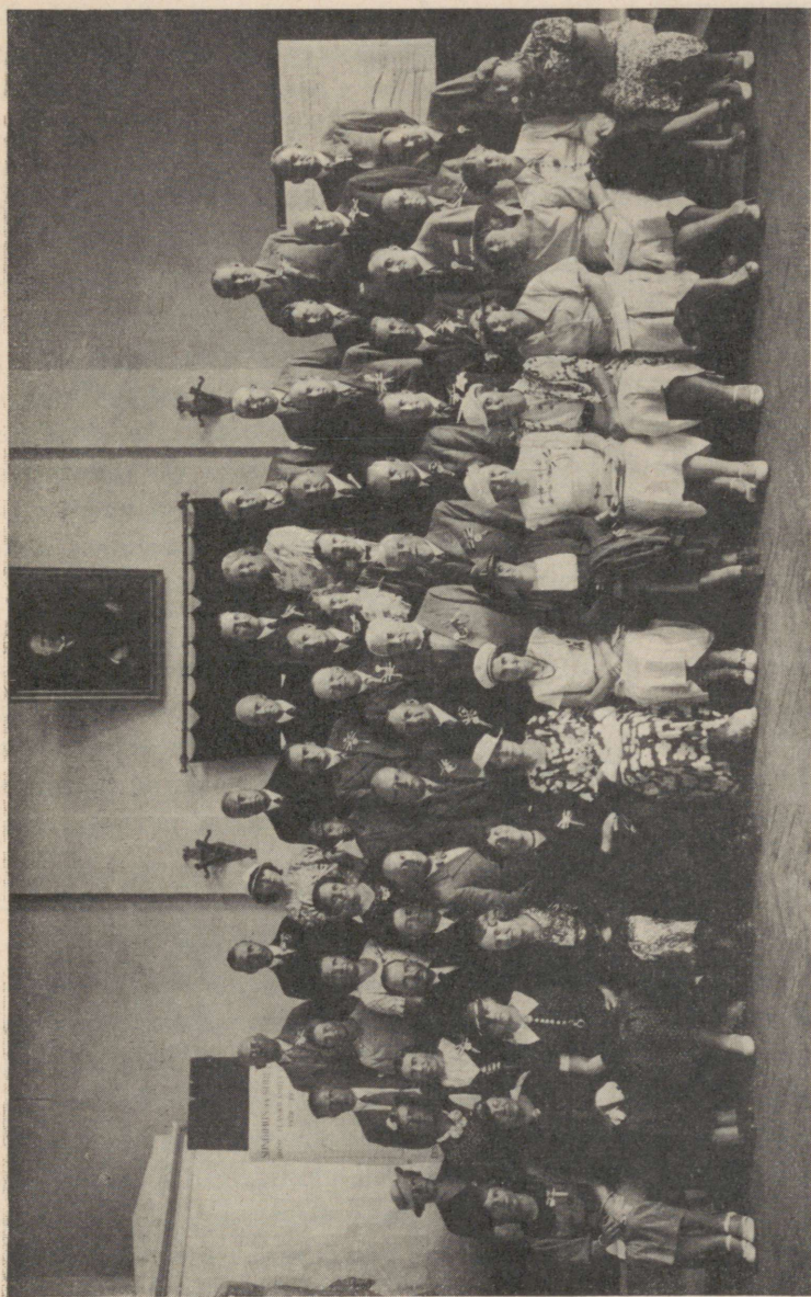
V Soome-Ugri kultuurkongressi arstideksioonist osavõtjad.