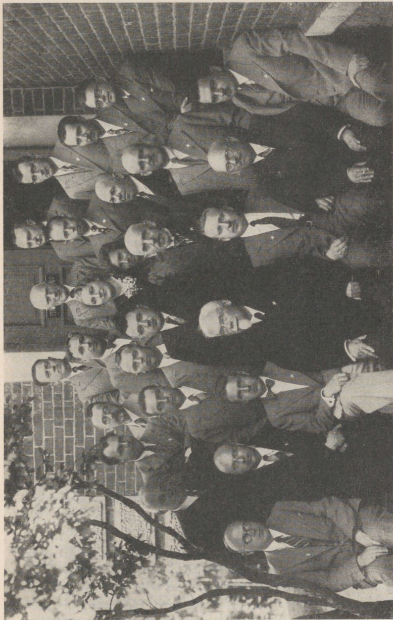
Eesti Arstideseltside Liidu peakoosolek 23. mail 1937.