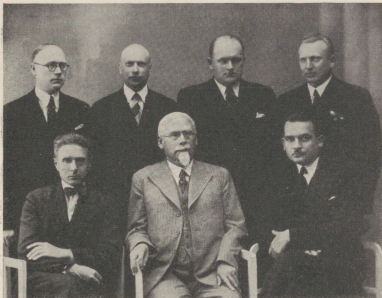
Eesti Arstideseltside Liidu juhatus 1937.

eestseisuse asemel tuleks valida kummagi liidu poolt üks volinik; 2) volinikud tuleksid kokku tarviduse järgi ühe poole nõudmisel; 3) ühiste otsustele kirjutavad alla mõlemad volinikud; otsused lähevad kummagi liidu juhatusele kinnitamiseks. Aukohtu asjus otsustati: 1) ühe liidu aukohtu otsused ei ole iseenesest siduvad teisele poolele, kuid nim. otsused võivad teisele poolele siduvaks saada, kui teise