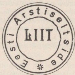
Eesti Arstideseltside Liidu pitser.