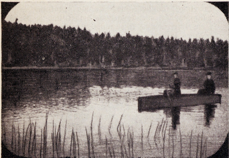
Rääk-järv Wafawere nōmmel