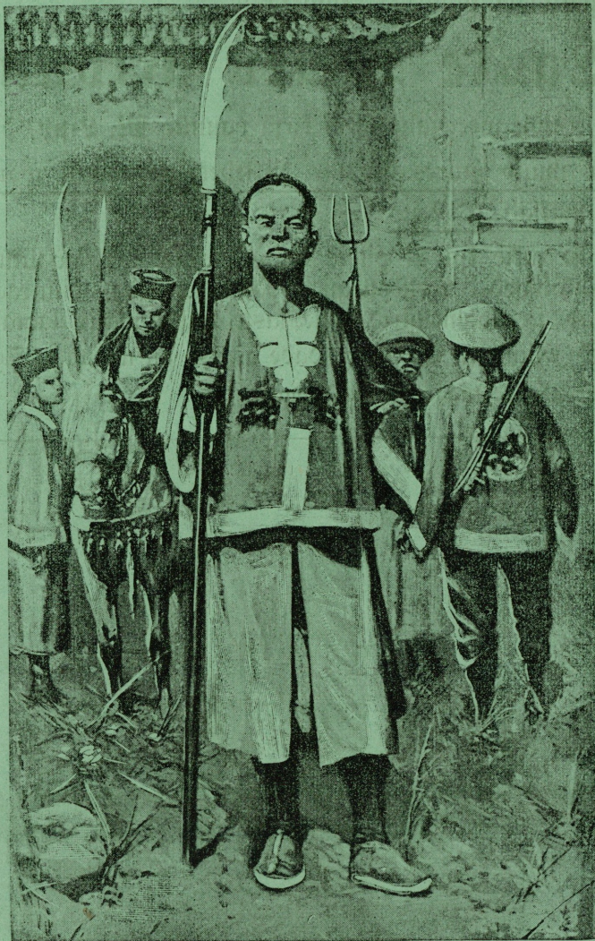
Suure rusika seltsi sõjamehed. Näitepilt „Idulu Albumist.“

Дозволено цензурою. Юрьевъ 8. Сентября 1900 г. Тип. Лашинскаго, СПб.