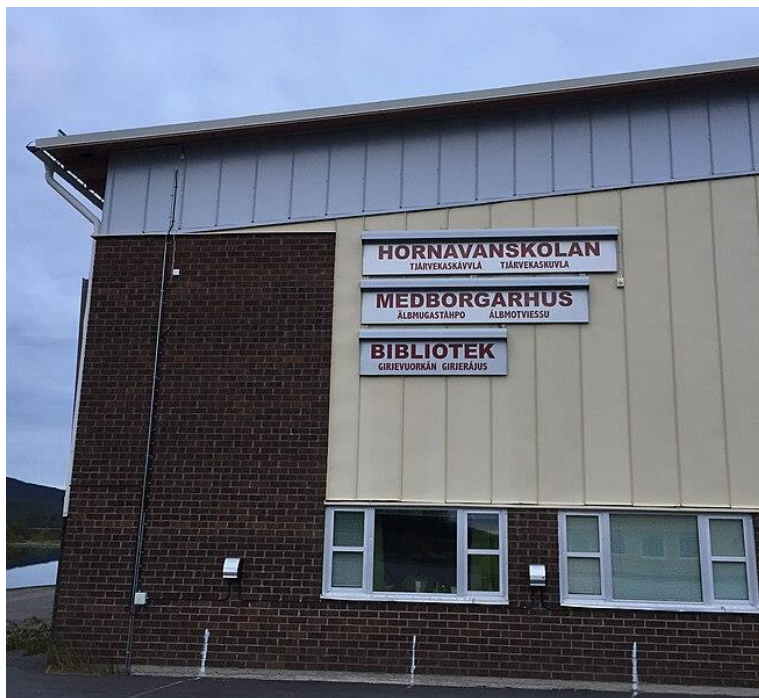
Figur 2 Skyltar i Arjeplog som använder svenska (stora bokstav), pitesamiska (på vänster) och nordsamiska (på höger).

Angående nya domäner i skolan finns det ingen fjärrundervisning för pitesamiskan (Lägesrapport 2023, 2023, s. 47).