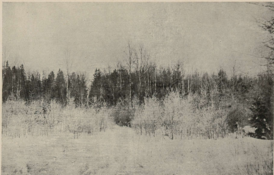
Pilt nr. 6.