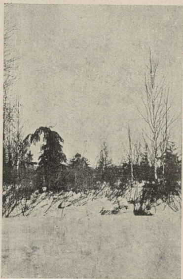
Pilt nr. 4. Kask metssool.