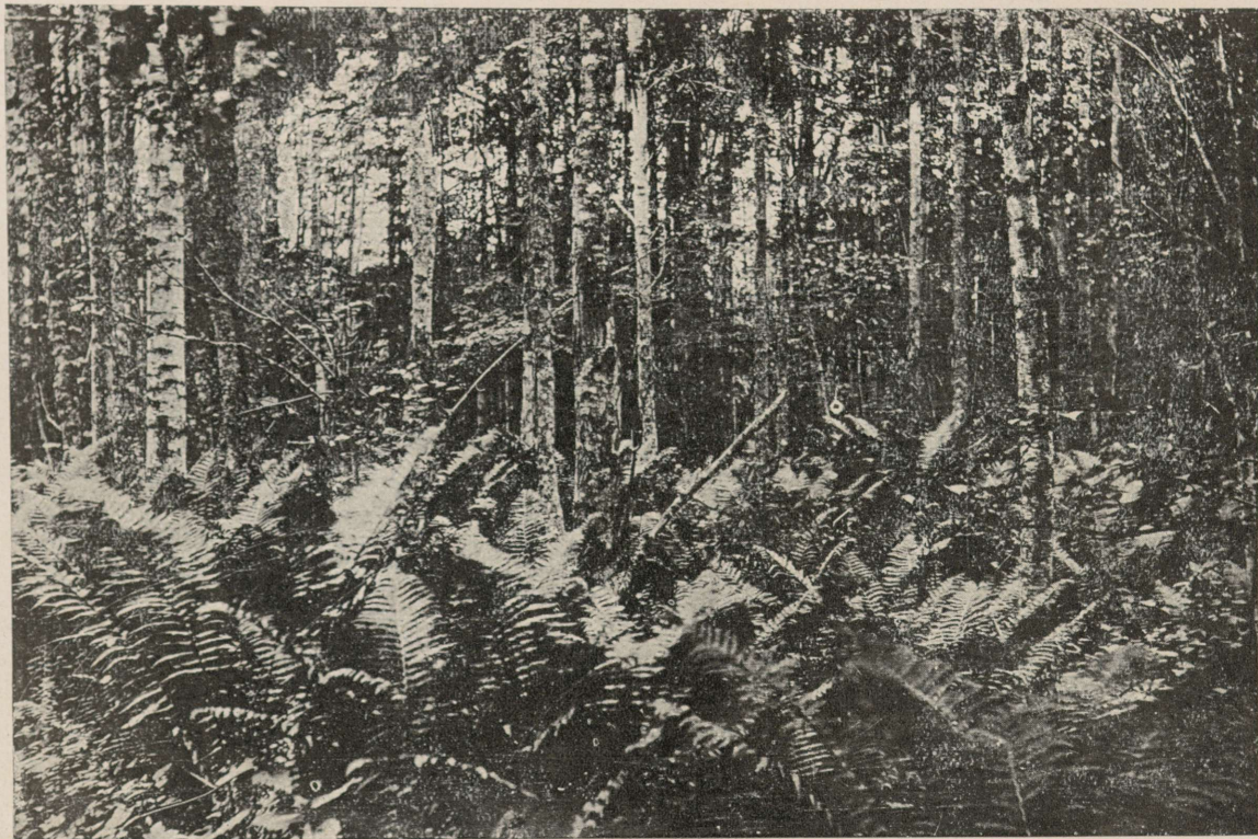
Pilt nr. 5. I bon. kase puiestik. Õpemetskond, kv. 58. Vanadus 40 a.