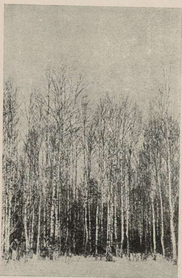
Pilt nr. 3. II bon. kase puestik.