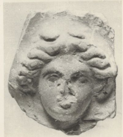
3. Головка-налеп. Терракота. I вв. до н. э. Афрасиаб