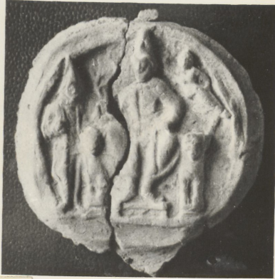
Гривна савна, Терракота.