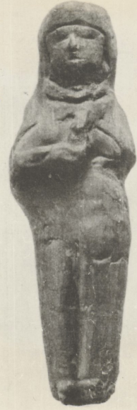
египетской I—III вв. маркино