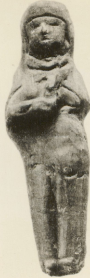
египетской — III вв. маркино