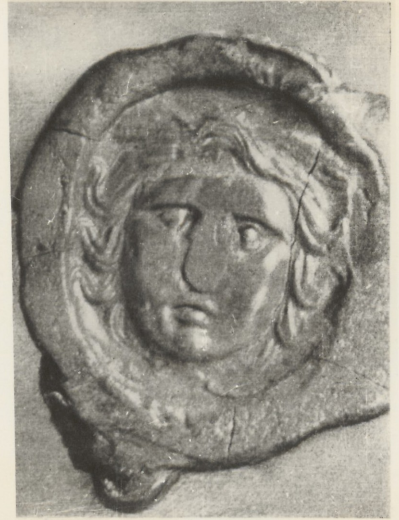
1. Головка с косичками. Терракота.