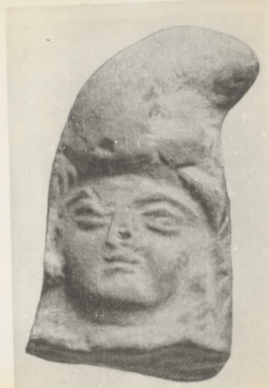
60. Юноши: в скифских кlobуках. Террако