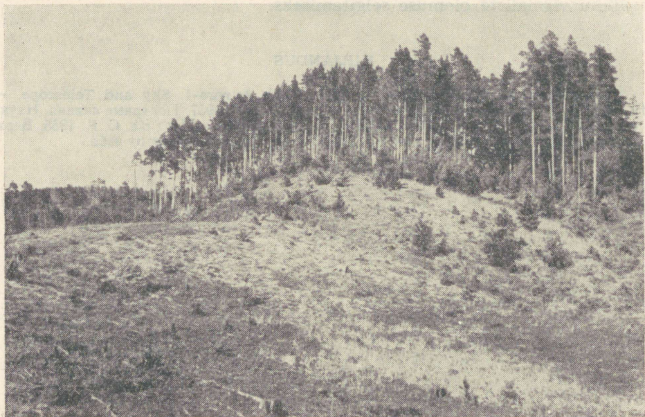
1. joon. Luited Iisakust läänes.

Viirsavitaolise kihilisusega peeneteralistes setted, mis moodustavad sopiliste piirjoontega lavasid ning kohati isegi kuppeljaid ja seljakulisi vorme, levivad ka Iisaku ümbruse tasandikel. Eriti ulatuslikult esineb neid lääne pool kuni Mäetaguse oosini. Tasandikul on nad enamasti liivasemad; kohati leidub ka mõhnastikulisi liivu. Nende väikeste mõhnade reljeefivormid on kohaliku jää-paisjärve ja Suur-Peipsi lainete tegevusel kaduma läinud. Suuremat mõju on avaldanud aga lääne- ja loodekaarte tuuled, mis on liivad kuhjanud ulatuslikeks, kuni 20 m kõrgusega liuteahelikeks (1. joon.).