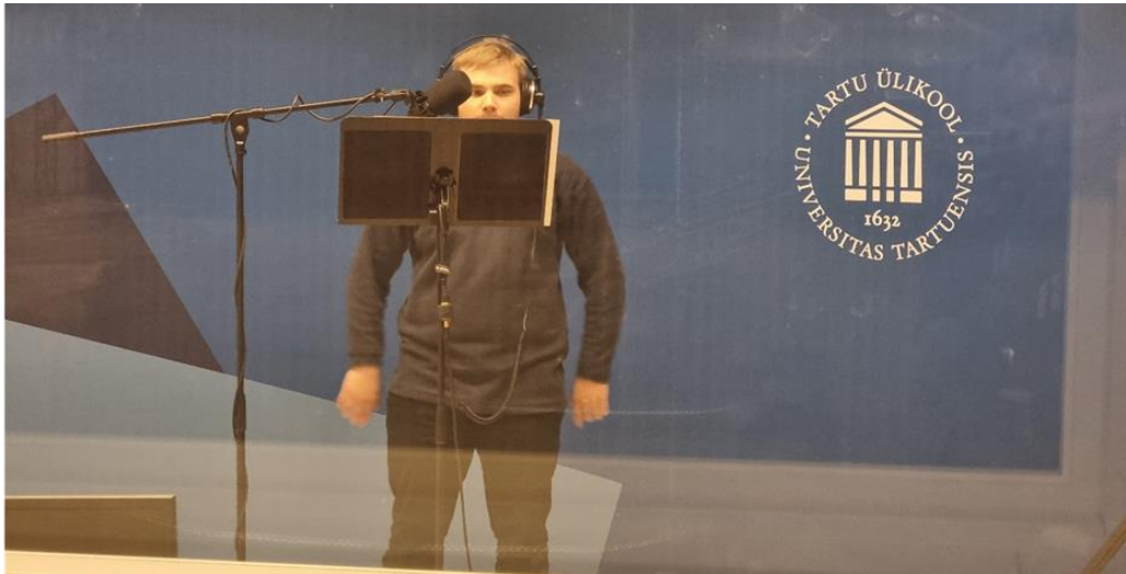
Joonis 5. Tudeng loeb teksti.

liiga pikki ja lohisevaid lauseid, sest hiljem pole võimalik seda teksti veenvalt sisse lugeda ja tudeng ei saa aru, kuhu teha pausid lugemisel. Samuti peaks ka tegema hääleharjutusi vahetult enne teksti sisselugemist ja teksti mitu korda enne salvestamist kõva häälega läbi lugema.