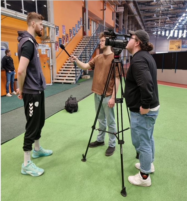
Joonis 3. Operaatori ja reporteri vaatlus võttel 12. aprillil 2024.

Üks suurimaid probleeme, mis jäi silma vaatluse käigus, oli intervjuude kadreering ja seeõttu on tugimaterjalis just sel teemal mahukam peatükk. Kadreeringu osas eksisid kõik tol päeval võttel käinud tudengid. Ideaalset kadreeringut ei leidnud ma musta materjali hulgast ja peamiselt oli intervjuueeritav kadreeritud liiga plaani keskele, mitte ühte serva. Pea kohal oli mitmetel juhtudel liiga palju tühja ruumi. Puudus sügavus ja intervjuueeritava selja taga polnud piisavalt vaba ruumi. Probleemid said alguse juba sellest, kuidas intervjuud tehti, sest reporter ei seisnud kaamera kõrval, vaid kuskil 1–2m eemal. Juhul, kui reporter ei seisa õlg statiivi kõrval, on operaatoril hea kadreeringu saamine juba eos keeruline. Tihti vaatas intervjuueeritav eemale ja jäi liiga profiili. Allpool näited, mille vastu reporterid ja operaatorid võttel eksisid. Ühel juhul oli kaamera ja reporter üksteisest mitme meetri kaugusel ja seetõttu jäi reporteri käsi kaadrisse.