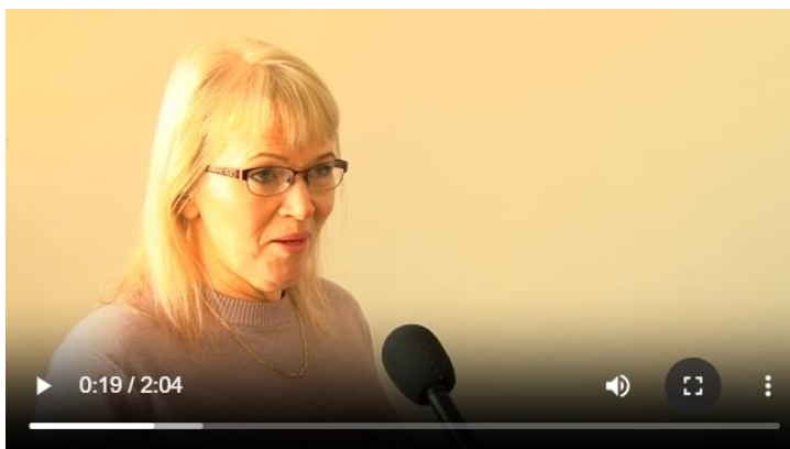
Joonis 2. Video on ülevalgustatud ja valgebalanss ei ole korrast. Ekraanitõmmis 12.aprilli uudistesaahest ( https://peegel.ut.ee/reporter/node/761 ).

Vaatluse käigus selgus, et kõik praktilise ajakirjanduse kursusel osalevad tudengid ei mõista veel, kuidas filmida selliselt, et videopilt poleks üle- või alavalgustatud, samuti oli mitmel juhul valgebalanss ( white balance ) korrast ära. Mitmeid katteplaanide ei saanud montaažis seetõttu kasutada, et pilt oli liiga tume, hele või kollane vms. Üsna kiirelt sai selgeks, et suur vajadus on teha samasugune tugimaterjal ka operaatori ja monteeri perspektiivist, koondades nii kõik tehnilised kriitilised küsimused ja soovitusel. Oleksin ise valmis seda tööd jätkama magistriõppes.