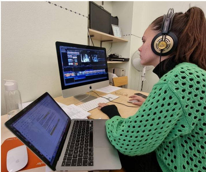
Joonis 1. Montaaži vaatlus 12. aprillil 2024.

kiiremini üles ning otsiksid kas üheskoos või koos aine õppejõududega lahenduse faasis, kus saab veel midagi muuta.