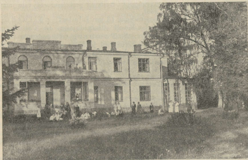
Tundmatu foto 1934. a.

Kooli kestuse ajal, s. o. 15 aasta jooksul, on koolist läbi käinud üle 300 õpilase; neist on suurem osa kursuse lõpetanud. Enamik õpilasi pärineb Läänemaalt. Kooli lähim ümbruskond — Vigala kihelkond — on andnud 42% kogu õpilaskonnast. 1935./36. õ.-a. on koolis 20 põllutöö- ja 21 aiatööõpilast.