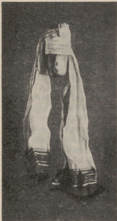
Pilt 6. Mordvalaste püha štatol.

suure küünla südameks harilikku kirikuküünla otsa, millele siis vaha ümber lisandades kasvatatakse ülemalkirjeldatud püha küünal. Mõnikord ei süüdata seda s u u r t k ü ü n a l t e n n a s t, vaid selle servade külge asetatakse põlema paar väikest vahaküünalt. Küünal