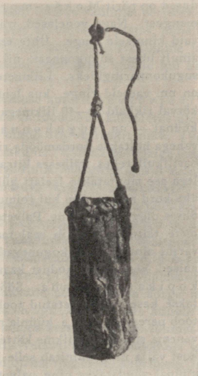
Pilt 7. Kooretorbik, milles štatol alal hoitakse.