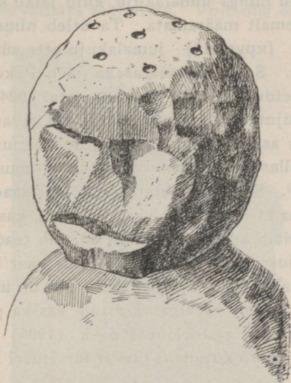
Pilt 3. Peko pea; pealael näha seitse auku küünlajäänustega. ERM, A 387:64 (vrd. pilt 1, 2).

Niipalju ERM-s hoitavast Peko kujust. Edasi vaataksime, millisena senised teated kujutavad Pekot ja selle maist olemust. E e s t i R a h v a l u u l e A r h i i v i s hoitakse alal veerandsada üksikkir-