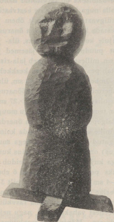
Pilt 1. Peko eestvaates.