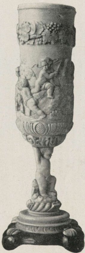
Peeker (Lõuna-Saksa?) 29 sm kõrge