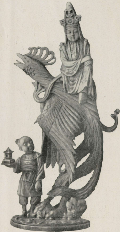
Kwannon imelinnul, 35 sm kõrge