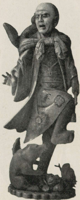
Karjuv figuur, 24 sm kõrge