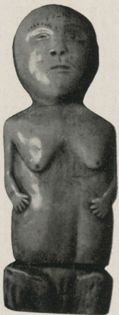
Ebajumal ( mammuti-luu )