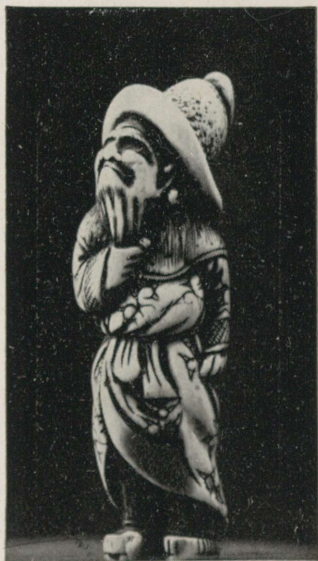
Enne A. Krusenstern'i kollektivs.