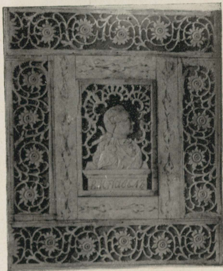
Suurvürst Paul (18. s. lõpp)