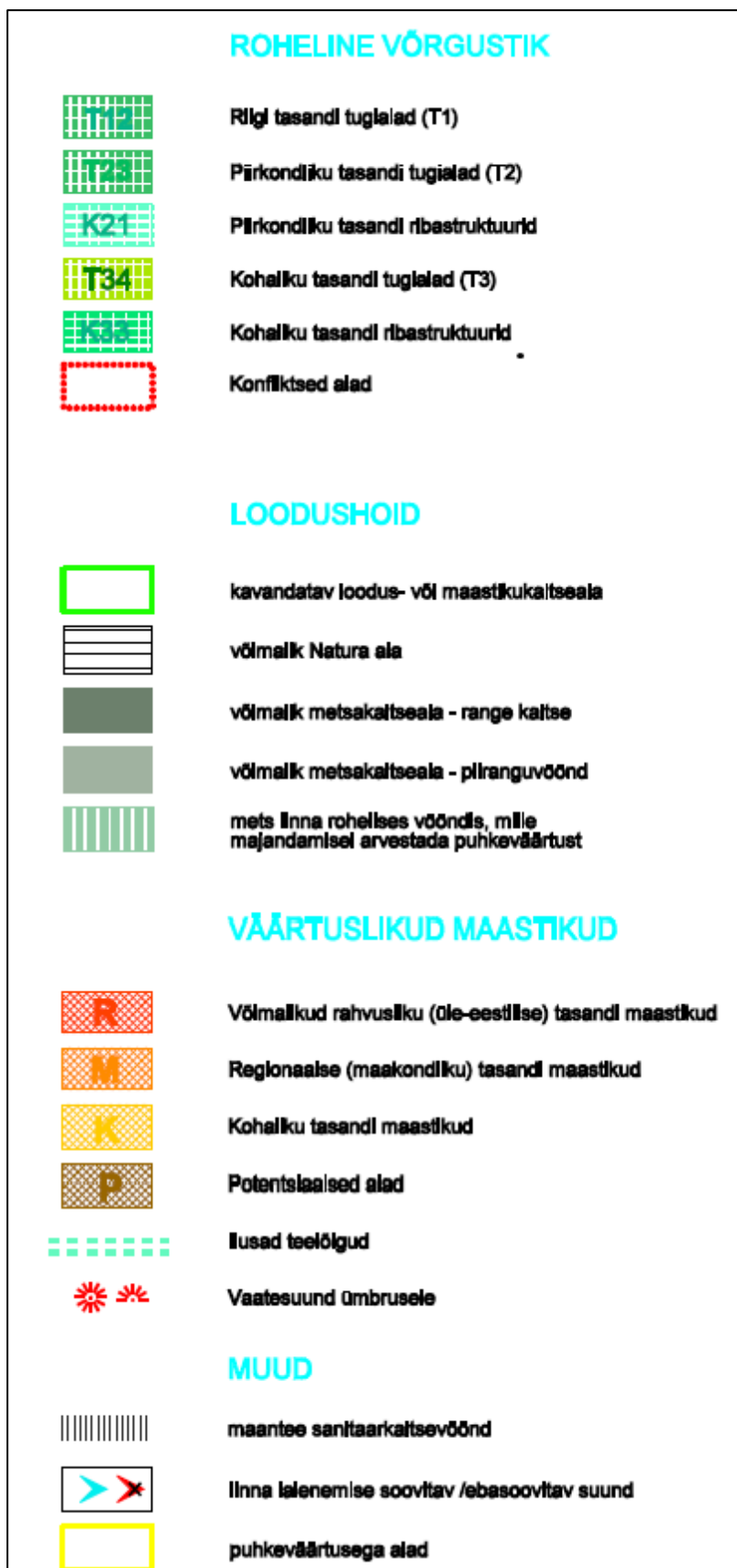
Joonis 1. Keskkonnatingimuste planeeringu kaart ja legend. Allikas: Tartu Maavalitsus 2004-2006b.