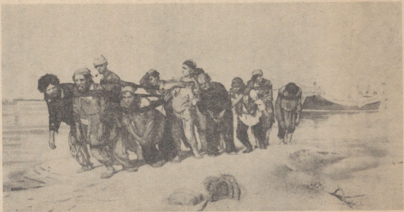
Картина И. Е. Репина «Бурлаки».