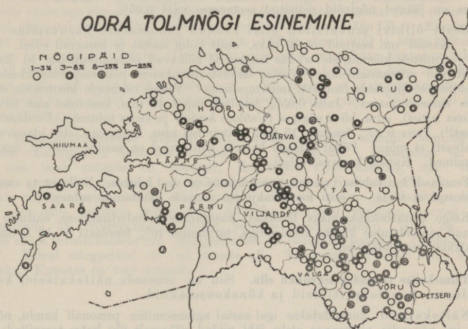
Kartogr. nr. 13.

Neid asjaolusid arvesse võttes, seati üles selles katses kaks küsimust: a) kas kuivkuumus võib asendada kuumvee peitsimise, b) leida tegelikus majapidamises kergemini läbiviidav ja odav kuumvee peitsimise seadis.