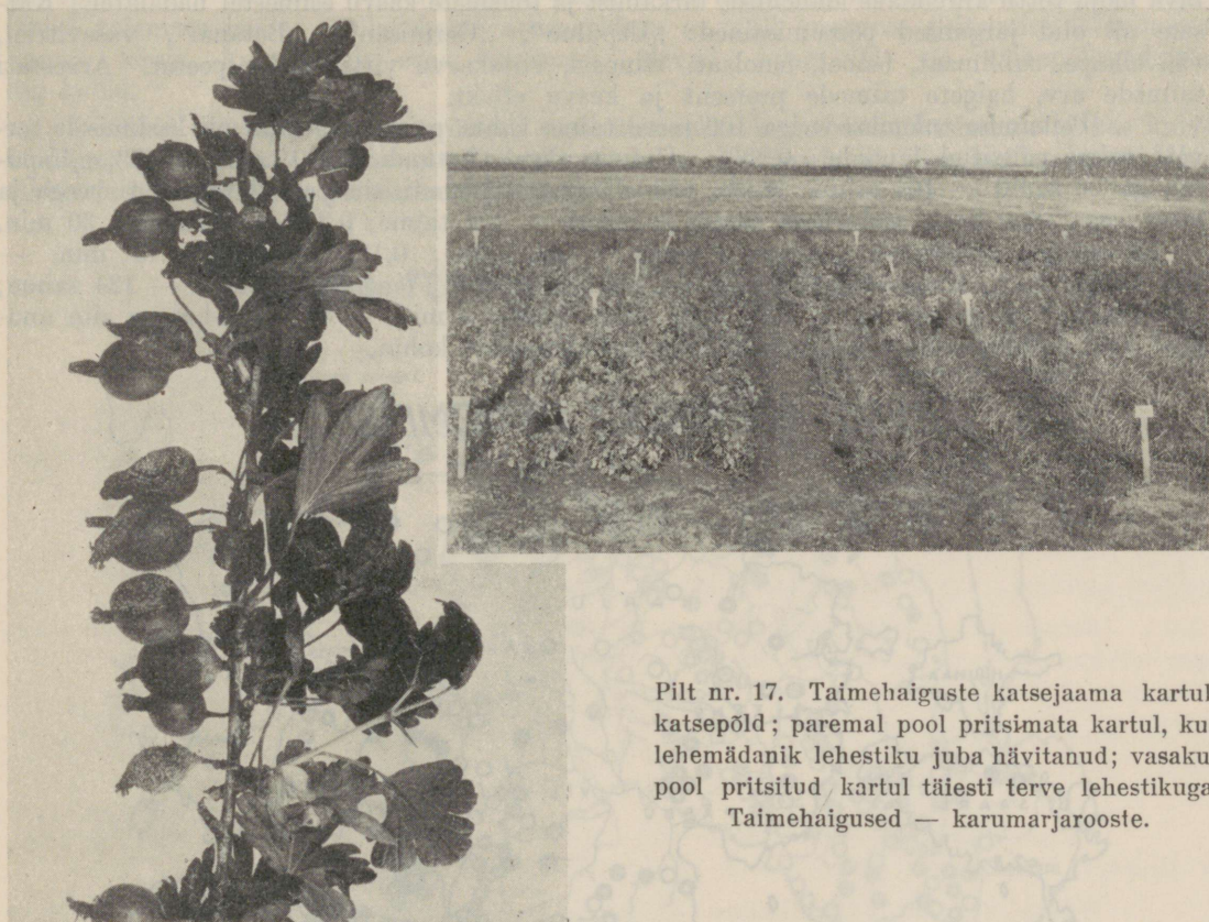
Pilt nr. 17. Taimehaiguste katsejaama kartuli katsepõld; paremal pool pritsimata kartul, kus lehemädanik lehestiku juba hävitanud; vasakul pool pritsitud kartul täiesti terve lehestikuga. Taimehaigused — karumarjarooste.