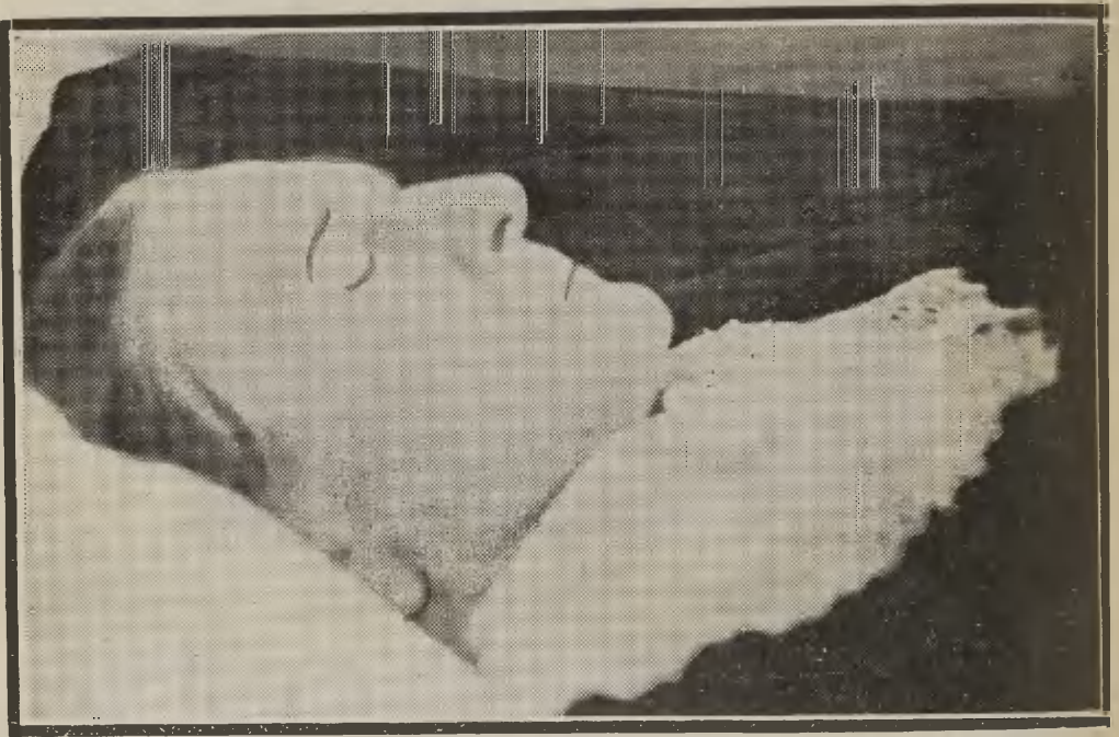
Piiskopp Kukk puusärgis.

Septembri kuu keskel astus noor usuteaduse üliõpilane Eesti Üliõpilaste Seltsi, kelle vilistlasperre lahkunu kuulus surmani, võttes tegelikult osa Seltsi tähtsatest sündmuspäevadest.