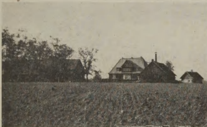
Õngu talu praegu.