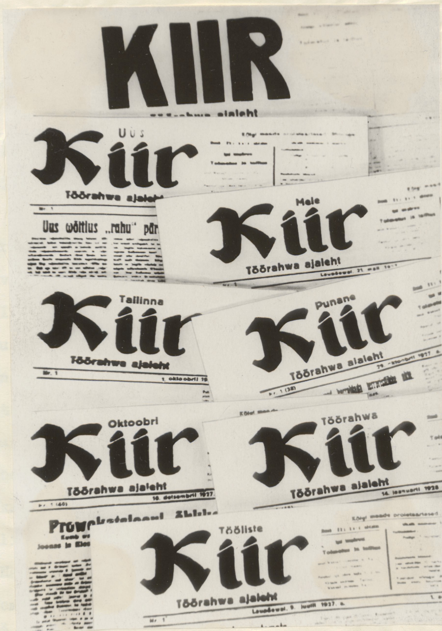
Eesti legaalsed revolutsioonilised töölisajalehed aastail 1927-1928.