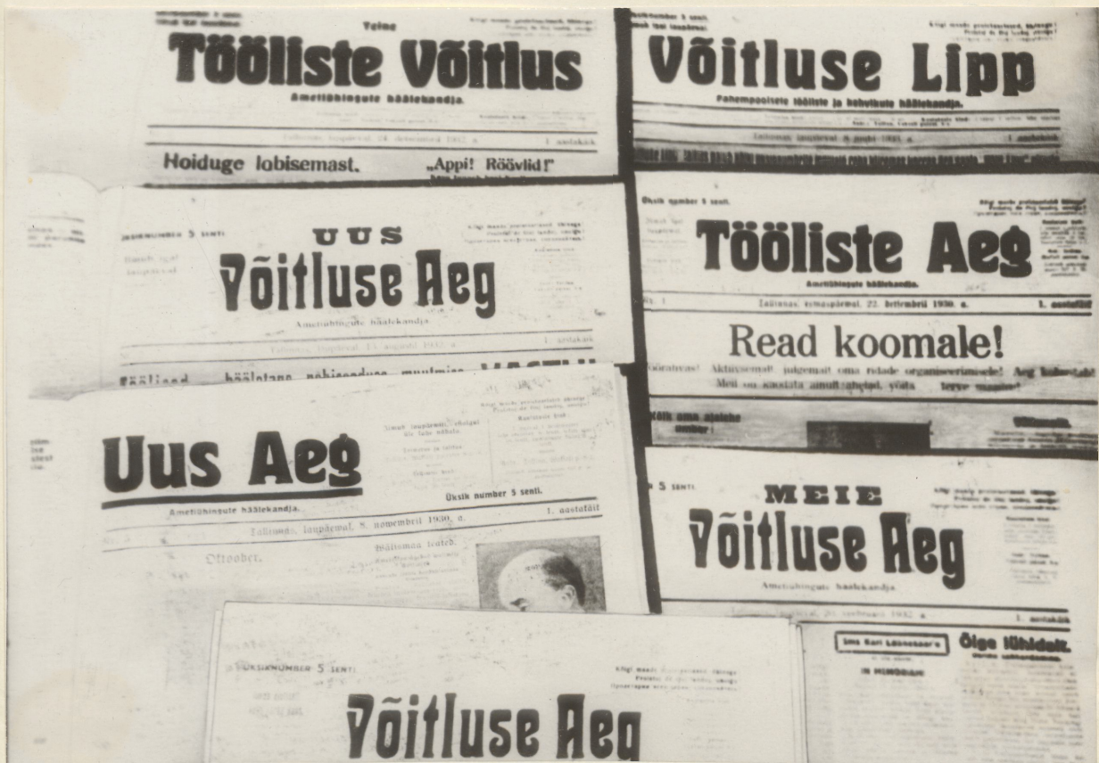
Pahempoolsete ametiühingute ajalehed aastail 1930-1933.