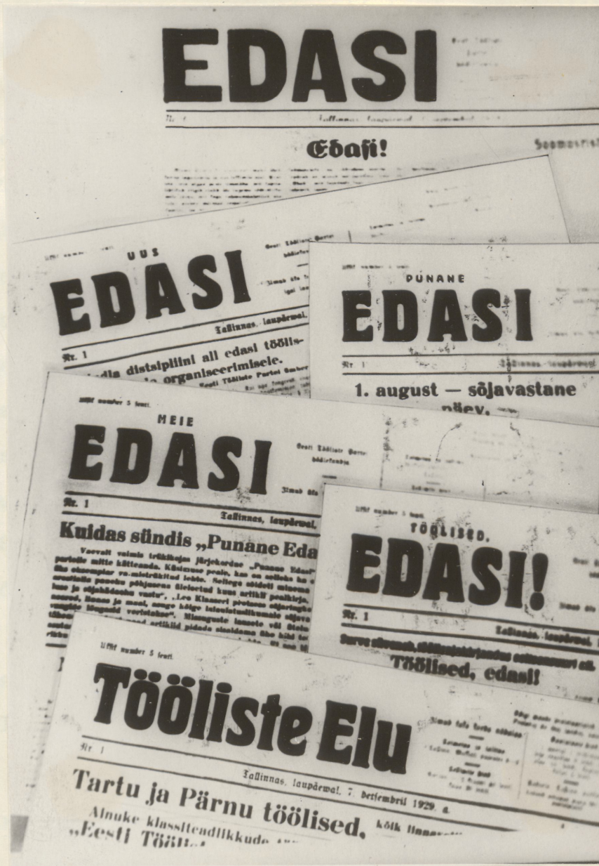
Aastail 1928-1930 ilmunud Eesti Töölised Partei häälekandjad