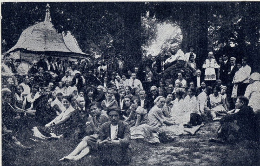
„У камня Св. Марка“. Группа членовъ Печорскаго съѣзда на Святой Горѣ.

Горячо сочувствуя работѣ Русскаго Студенческаго Христианскаго Движенія, призываемъ всѣхъ русскихъ людей съ любовью и вниманіемъ отнестись къ его призыву и оказать ему посильную помощь.