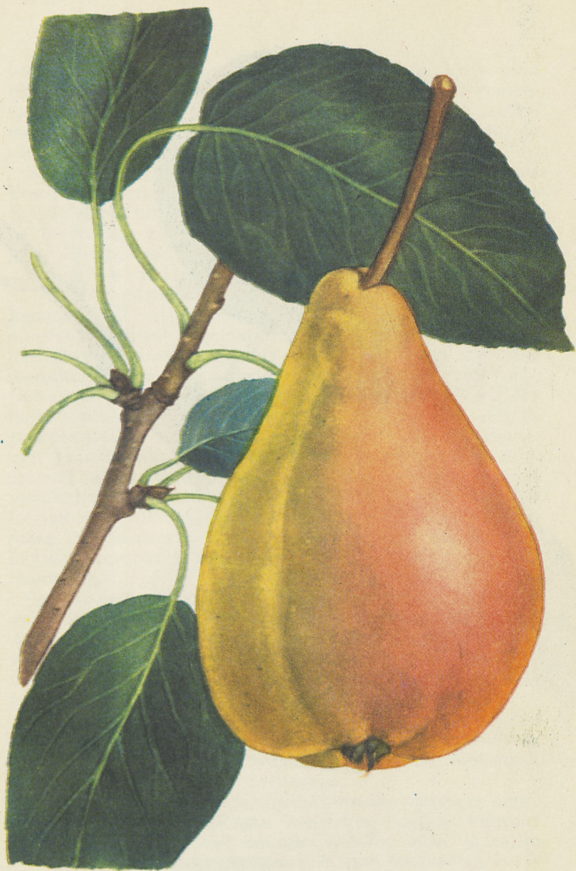
Tahvel 5. Kui pirniseemik nr. 10, mille emasordiks on 'Marguerite Marillat', 1958. aastal esmakordselt viljus, tundis aretaja suuremat rahuldust kui kunagi varem. Oli ju nüüd käes tõend, et ka meil saab aretada ja kasvatada kõrgeväärtuslikke dessertpirne. Seepärast saigi uus pirnisornt nimeks 'Kurvitsa lemmik'.