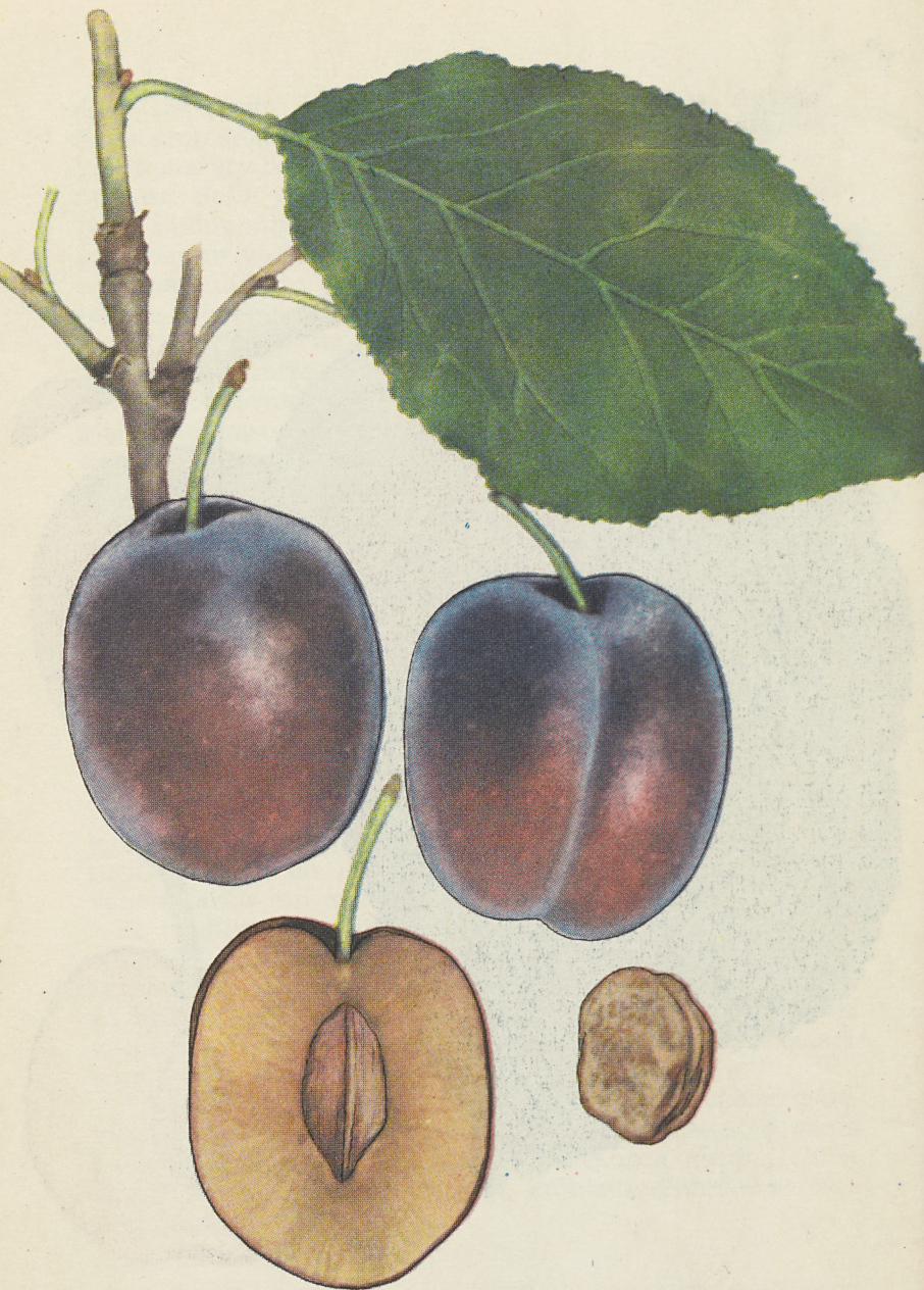
Tahvel 2. Ploomiseemiku nr. 47 viljad on tunduvalt tumedamad kui emasordil 'Emma Leppermann'. Nad on ka palju vürtsisemad ja suurema suhkrusisaldusega. Seemikule olen kavandanud nimeks 'Perenaise rõõm'.