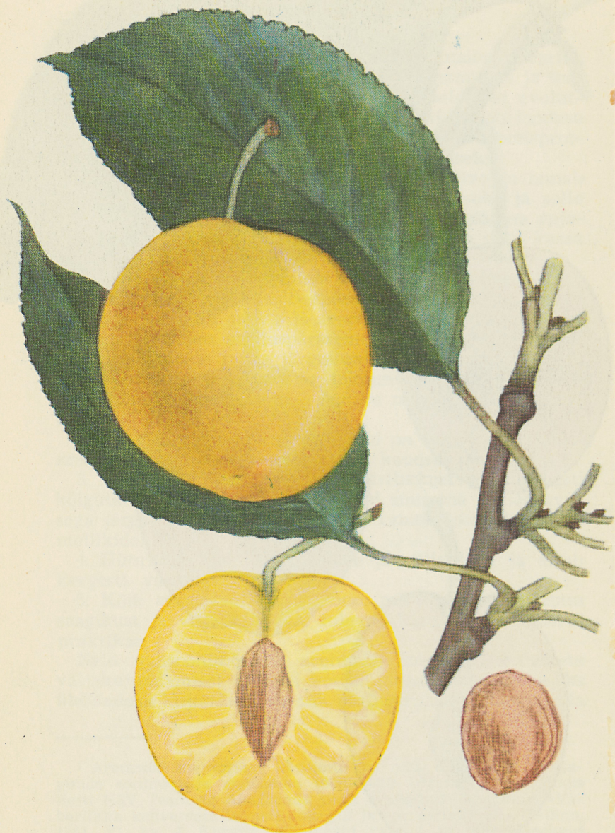
Tahvel 4. Ploomiseemik nr. 63 sai oma ülisuurte viljade tõttu nimeks 'Raitploom'. Nad on hilise valmimisega ning esmajärgulised mitte ainult välimuselt, vaid ka maitselt, mis on lähedane emasordi 'Washington' omale.