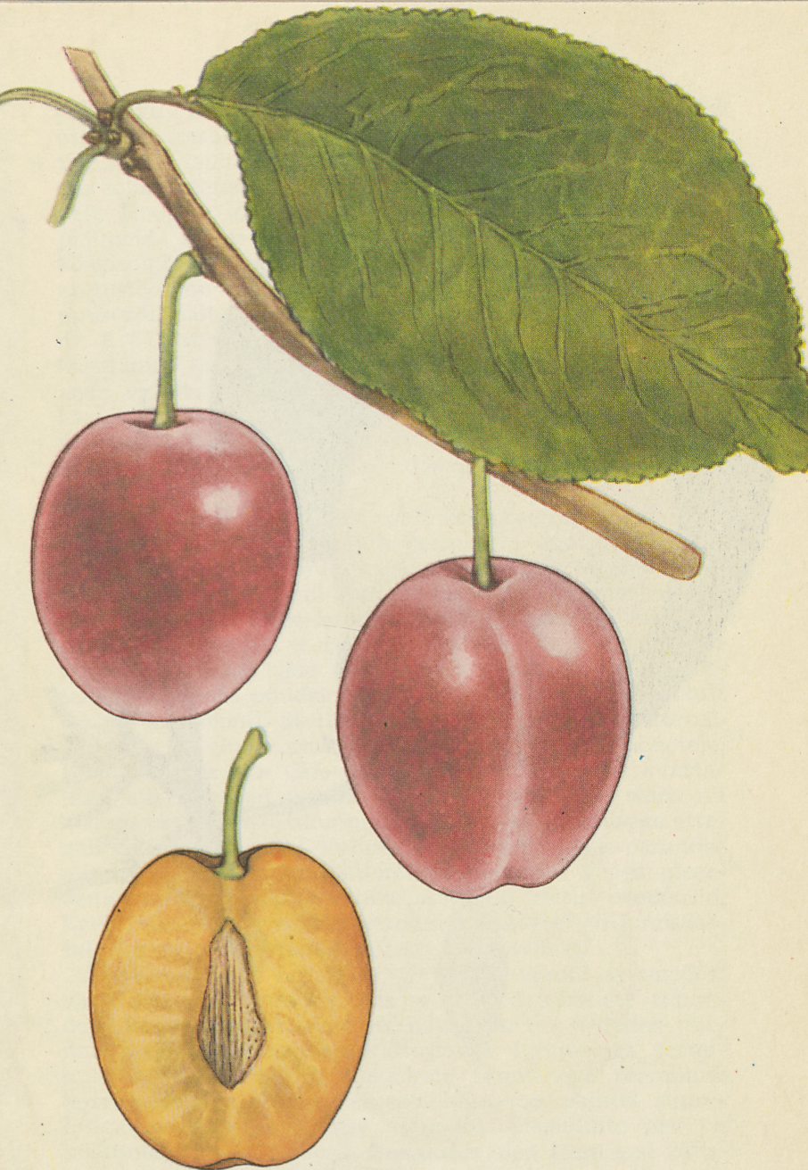
Tahvel 3. Ploomiseemiku nr. 48 viljad valmivad niisama hilja kui emasordil 'Viktooria'. Seepärast kavandasin seemikule nimeks 'Tartu hiline'. Viljad on magusad ja meeldiva happesusega.