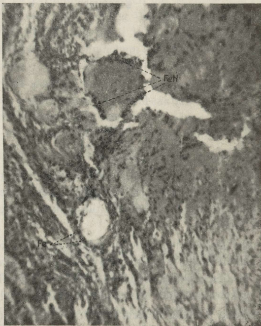
Abb. 1. Glioblastoma multiforme. Berlinerblau-Carmalaunfärbung. Fe — Speicherung von haematogenem Pigmenteisen in einer Gefäßwandzelle. FeN — Eisenablagerung an der Peripherie eines nekrotischen Herdes.

Dieses trat in Gebieten des Tumorgewebes auf, wo Blutergüsse vorhanden waren, besonders in der Nachbarschaft von Gefäßen. Das Eisen war hier an Pigmentkörner von gelb-brauner Eigenfarbe gebunden, welche durch Einwirkung von Säuren das Eisen abgaben.