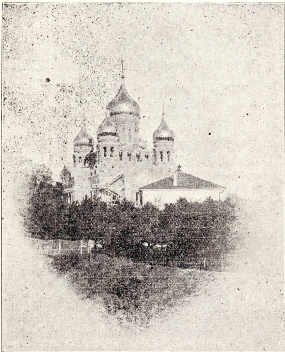
Ревельскій Александро-Невскій Соборъ.