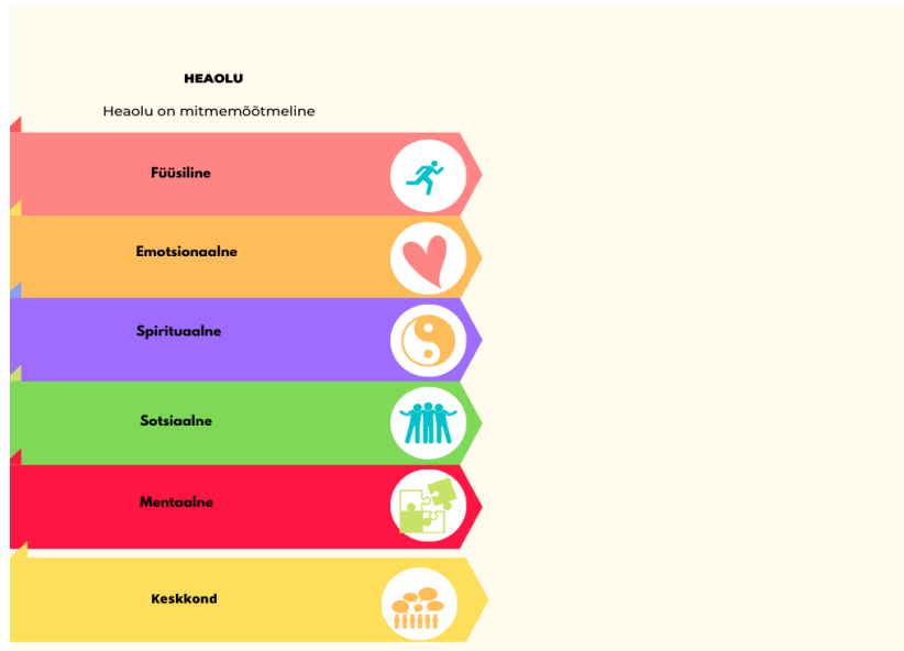
Joonis1. Heaolumõõtmel. Allikas:(Global Wellness Institute 2023)