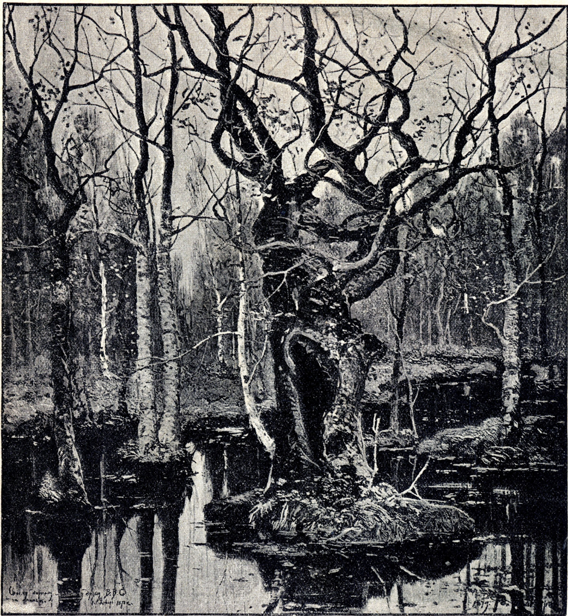
СУМЕРКИ ВЪ ЛѢСУ