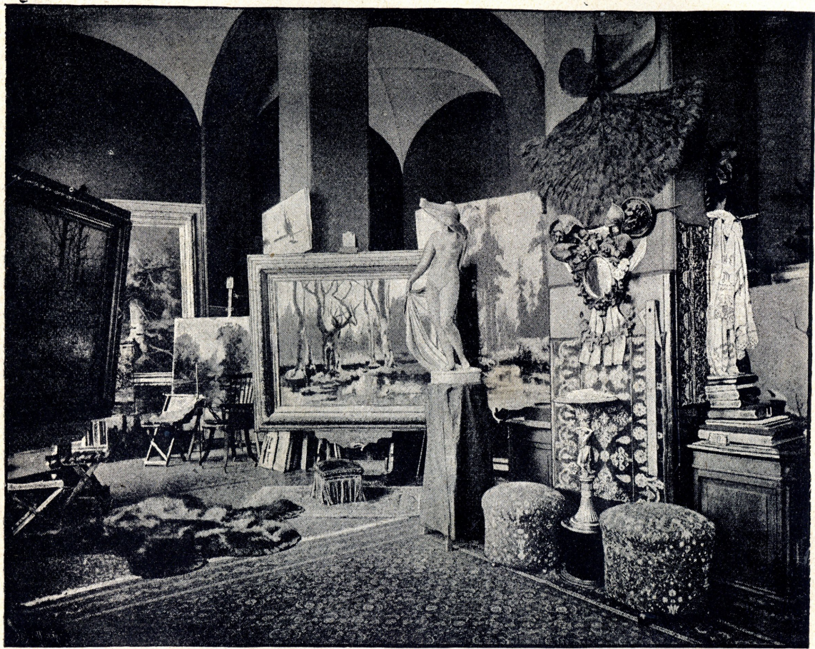
МАСТЕРСКАЯ Ю. КЛЕВЕРА

пейзажиста, а краски обличаютъ блестящаго колориста.