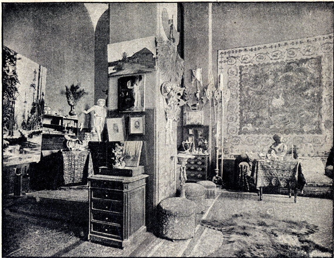
МАСТЕРСКАЯ Ю. КЛЕВЕРА

маніе было возбуждено картинами и этюдами на зимніе мотивы, съ эффектами вечерняго освѣщенія березовой рощи. Эти эффекты и эти мотивы сдѣлались излюбленными въ произведеніяхъ г. Клевера. Да иначе и быть не могло. Молодому художнику сыпались заказы со всѣхъ сторонъ, и онъ былъ вынужденъ повторяться. Но и на этомъ скользкомъ пути блестящее