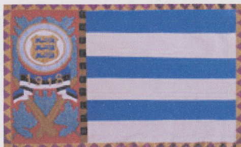
(Ida malevkonna lipu vasak külg)