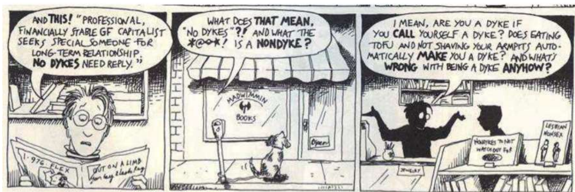
Pilt 3. Vaenusõna grupisene halvustav kasutus. Sõnaga ‘dyke’ viidatavate eristamine teistest gei naistest. 24