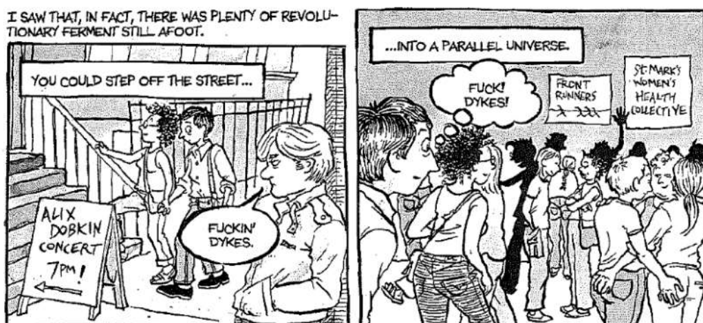
Pilt 2. Vaenusõna halvustav ja mitte-halvustav kasutus kõrvuti. 15

Pigem vaatame me selliste vaenusõna kasutuste järel tagasi kõneleja ja lausumise konteksti poole. Kui seejuures kontekst on kuidagiviisi sobilik, kõneleja täidab mingeid tingimusi (peamiseks neist paistab olevat vaenusõna sihtgruppi kuulumine), ja kui lausumise eesmärgiks ilmselgelt ei olnud halvustamine, vaid just vastupidi mingi positiivse efekti saavutamine, siis on lihtne näha vaenusõna kasutuses tagasivõtmist. Dykes on Bikes ja Dyke