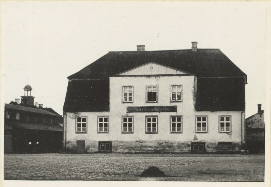
Endise Viljandi kreiskooli hoone