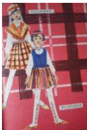
Joonis 28. Kullamaa tütarlaps Pilstvere tütarlaps