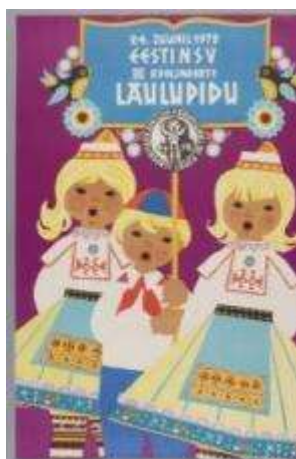
Joonis 4. 1972. a ETMM 8270 Af 95:5