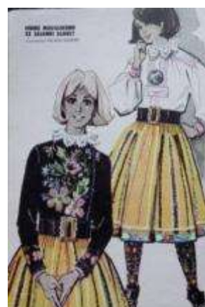
Joonis 39. Muhu neiu