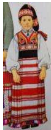
Joonis 51. Anseküla tütarlaps