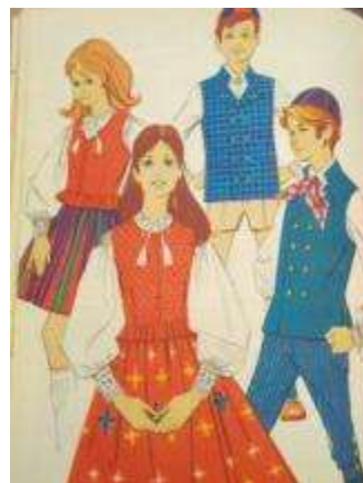
Joonis 34. Lihula tütarlaps Rapla poiss