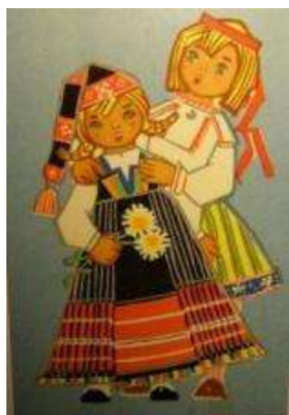
Joonis 7. 1966. a postkaart