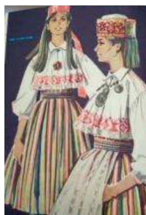
Joonis 38. Simuna neiu