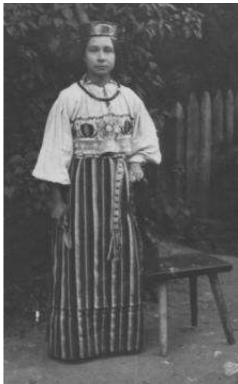
Joonis 12. 1930. a, Kadrina rahvariietes neiu (ERM Fk 513:6)