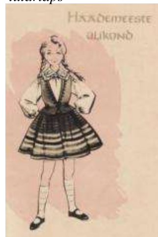
Joonis 18. Häädemeeste tütarlaps