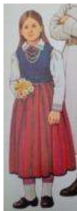
Joonis 50. Tori tütarlaps