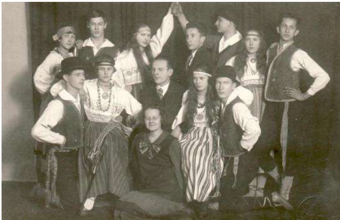
Joonis 8. Sport ja isetegevus Riisipere lastekodus 'Plato' aastail 1930-1934 (EPA M F_0052850_00004)