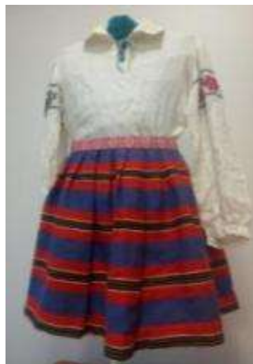
Joonis 5. Seelik ja särk (Torma kool)