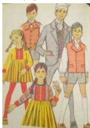
Joonis 36. Vormsi tütarlaps Jämaja poiss