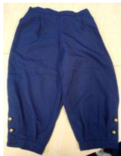
Joonis 12. Põlvpiüksid (Põltsamaa)