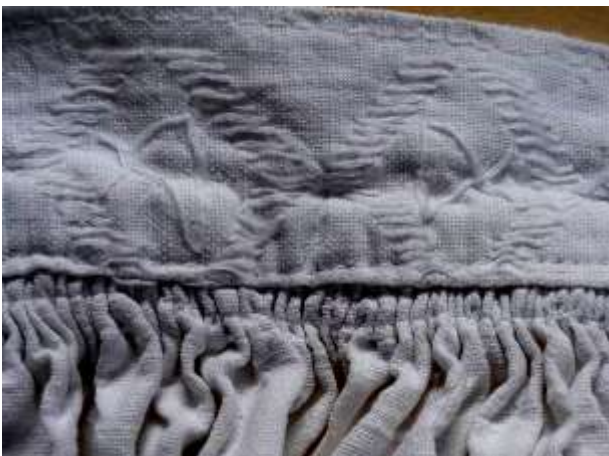
Joonis 28. 1980.–1990. aastatel valmistatud laste särgi kätis