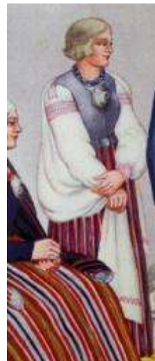
Joonis 3. Võrumaa neiu