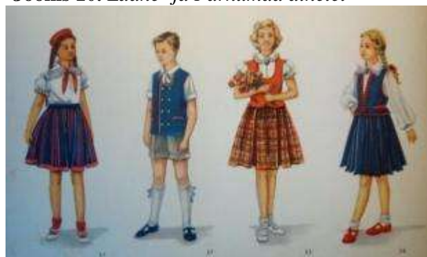
Joonis 10. Lääne- ja Pärnumaa ainetel