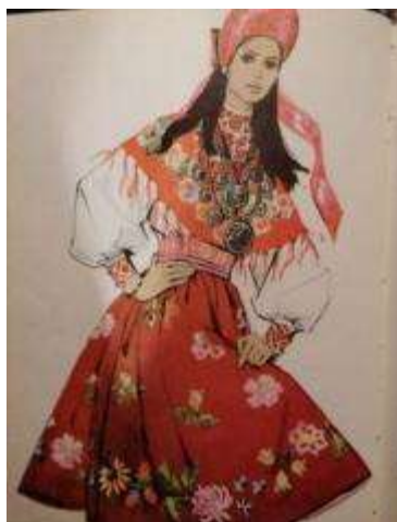
Joonis 45. Lihula neiu