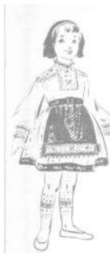
Joonis 62. Illustratsioon mustrilehelt. Nõukogude Naine 1958.a