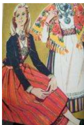
Joonis 37. Tori neiu