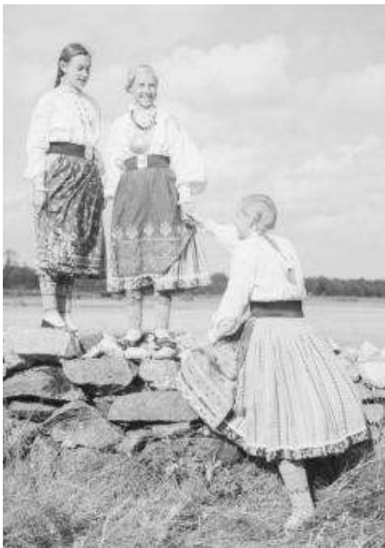
Joonis 11 .u 1930ndad (RMF FN 1040:1799)