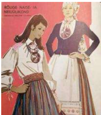
Joonis 44. Rõuge neiu Naine