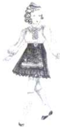
Joonis 60. Rahvarõivaid lastele. Kodutööstus 1939. a