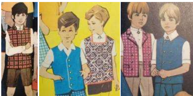
Joonis 63. Rahvuslike kostüüme väikestele peolistele Nõukogude Naine 1972. a