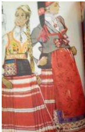
Joonis 41. Saarde neiu