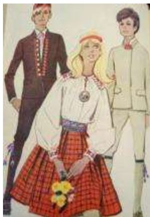
Joonis 33. Paistu neiu Tõstamaa poiss Hargla poiss