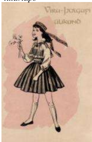
Joonis 16. Viru-Jaagupi tütarlaps