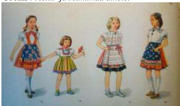
Joonis 9. Hiiu- ja Muhumaa ainetel