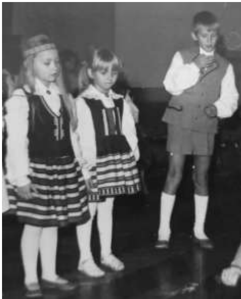
Joonis 20. Põltsamaa rahvatantsijad 1966. a