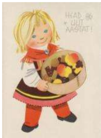
Joonis 8. 1966. a postkaart kunstnik L. Härm Erakogu