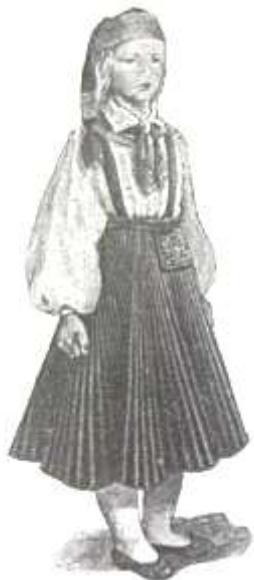
Joonis 13. Kärbla tütarlaps