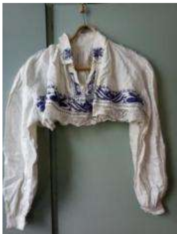
Joonis 7. Käised (Ulvi kool)