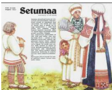
Joonis 19. Setumaa 1989:10