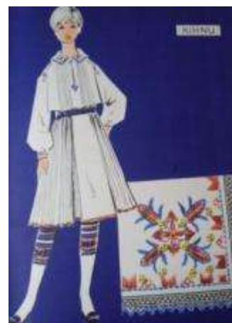
Joonis 30. Kihnu neiu