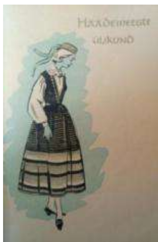
Joonis 22. Häädemeeste neiu