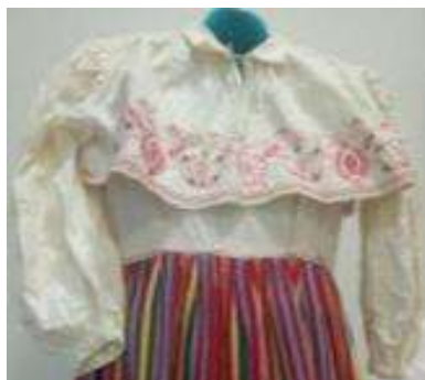
Joonis 8. Käised (Torma kool)