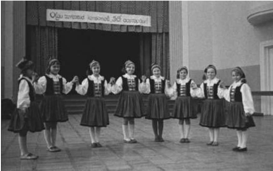
Joonis 19. ENSV Kunstifondi Kunstitoodete Kombinaadi tekstiilieteljees juubelilaulupeoks valmistatud Mustjala rahvarõivad 1968. a (EFA.204.0.75121)

Hoolimata riiklikul tasemel ette antud soovitusel, varustada kõik kollektiivid oma kodukoha rahvarõivastega, eelistati jätkuvalt kasutada esinemisrõivastena ENSV algaastatel populaarseks saanud valikuid (Joonis 19–21). Intervjueerides aastatel 1965–1980 tegutsenud lasterühmade juhendajaid ja rõivaste eest hoolitsejaid, selgus, et kodukoha triibuseelikus lasterühmad paigutati hoolimata kõrgel tasemel esinemisest tantsuväljaku tagumistesse ridadesse. 92 Tantsupeo juhtide otsustada oli loodavate mustrite koloriit. Põhialuseks võeti 1957. aasta rahvarõivaraamatus välja toodud kostüümid.