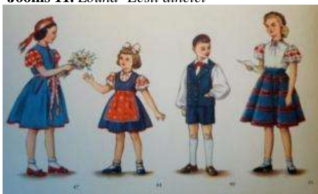
Joonis 11. Lõuna- Eesti ainetel