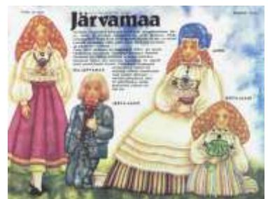
Joonis 15. Järvamaa 1989:6