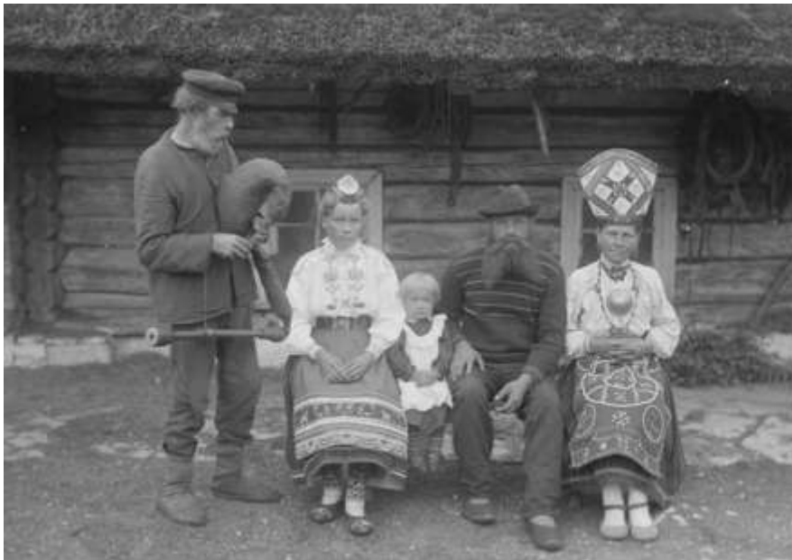
Joonis 5. Perekond Soonda külast Muhumaal. 1913.