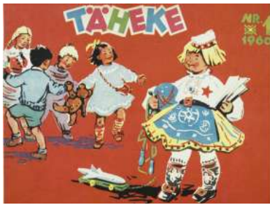
Joonis 10. Täheke 1960:1