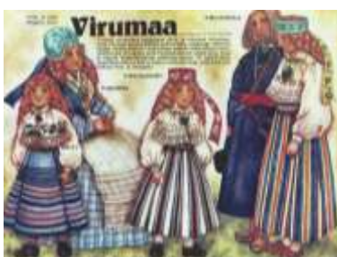
Joonis 16. Virumaa 1989:7