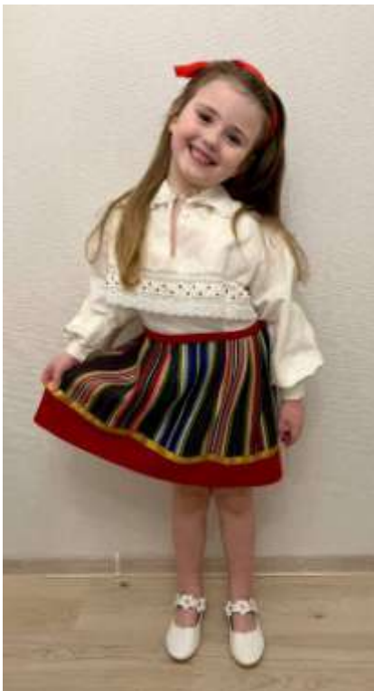
Joonis 30. Möödunud sajandist pärinevates rahvarõivastes tütarlaps. 2023. aastal