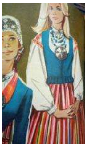
Joonis 40. Räpina neiu