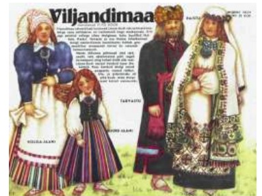
Joonis 18. Viljandimaa 1989:9