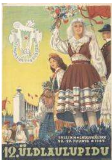
Joonis 1. Plakat 1947. a ETMM 8540 Af 64:16