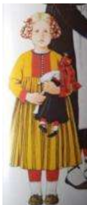
Joonis 47. Vormsi tütarlaps