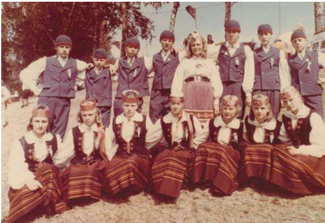
Joonis 24. 1988. a, EÕM rühmade isetegevuskava. Rahvariietes noored. (ERAF.2.2.7924.8)