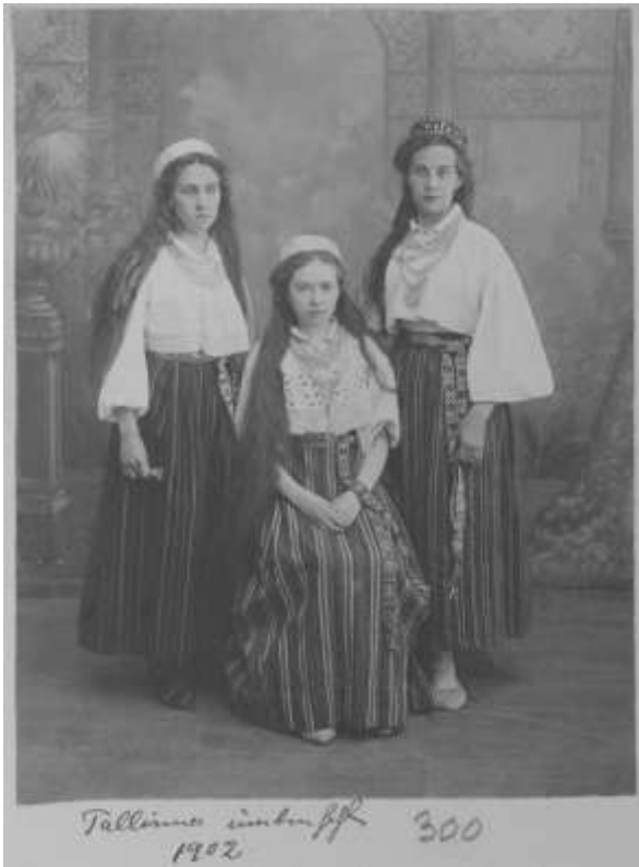
Joonis 2. Kolm neitut Tallinna ümbrusest.