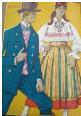
Joonis 42. Jõelähtme neiu