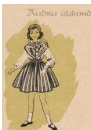
Joonis 20. Audru tütarlaps