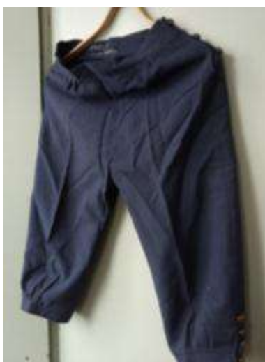
Joonis 10. Põlvpiüksid (Ulvi)