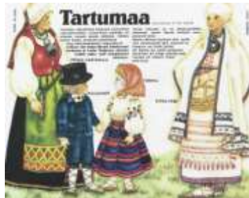
Joonis 17. Tartumaa 1989:8