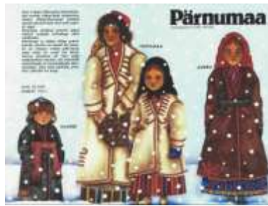
Joonis 11. Pärnumaa 1989:2