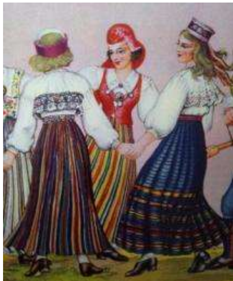
Joonis 5. Järva-Jaani neiu (vasakul)