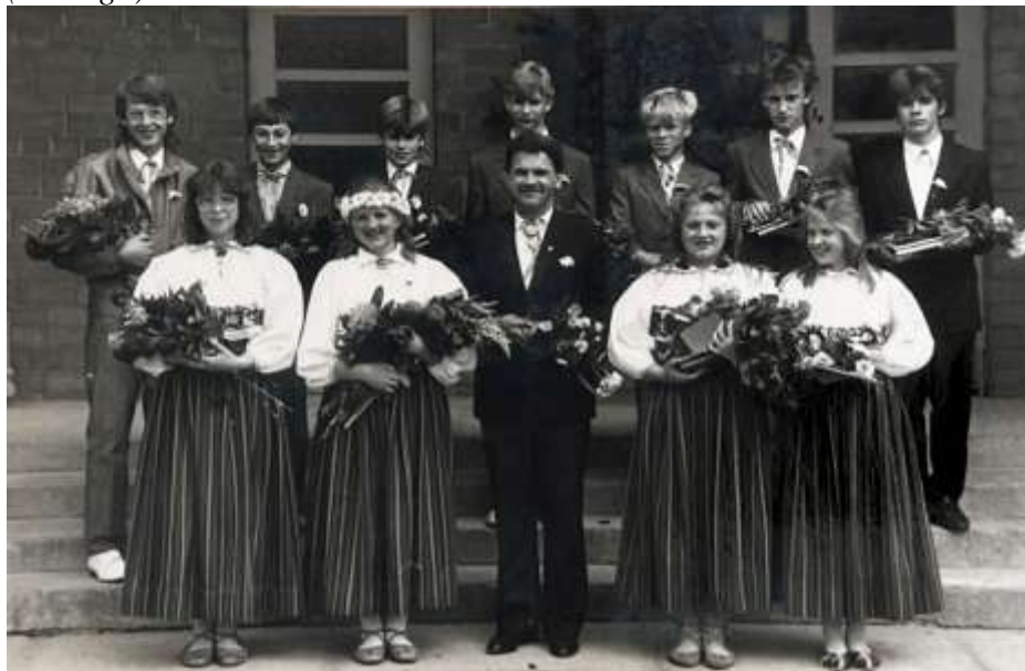
Joonis 25. Neiud omavalmistatud rahvarõivastes kooli lõpuaktusel 1991. a

Tavapärase oli lastele lasteaia lõpupeoks või mõne muu tähtsündmuse puhul valmistada ise rahvarõivad (joonis 26). Rahvarõivast kanda oli popp, eriti kui need olid enda valmistatud.