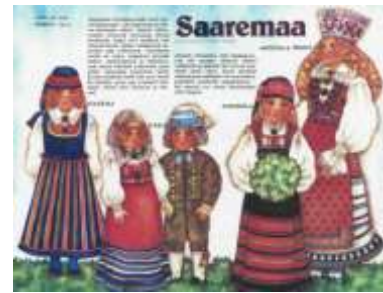
Joonis 12. Saaremaa 1989:3