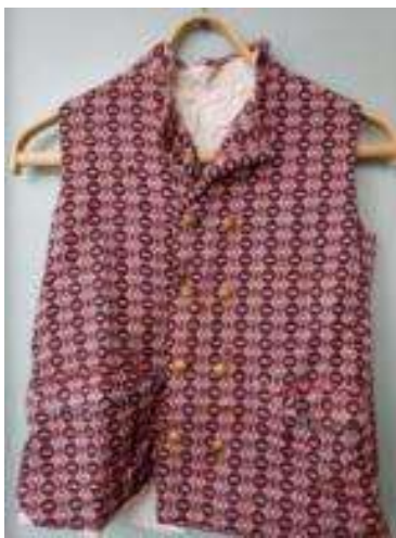
Joonis 1. Vest (kasutati Ulvi v Lohusuu koolis)