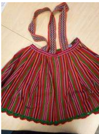
Joonis 13. Seelik (Põltsamaa)