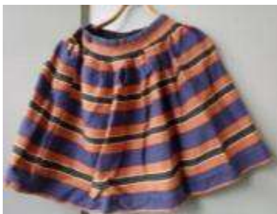
Joonis 4. Seelik (Ulvi kool)