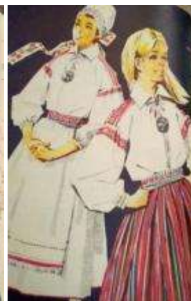
Joonis 35. Põlva neiu