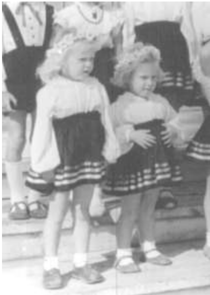
Joonis 16. Iisaku lapsed esinemas (IM F 397:64)