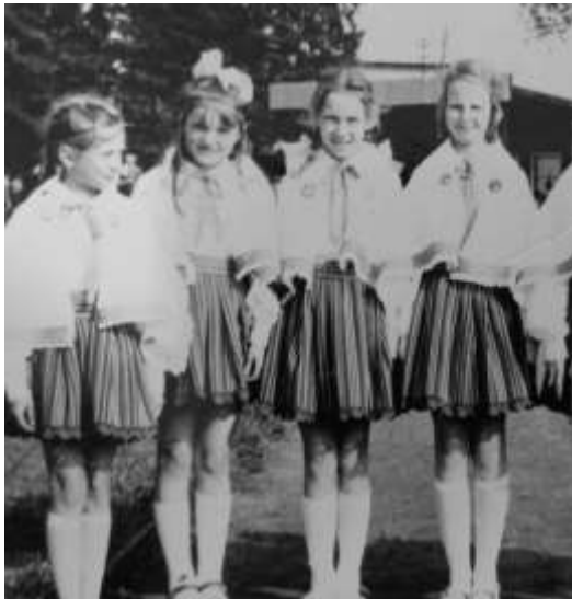
Joonis 23. Põltsamaa tantsijad 1975. a