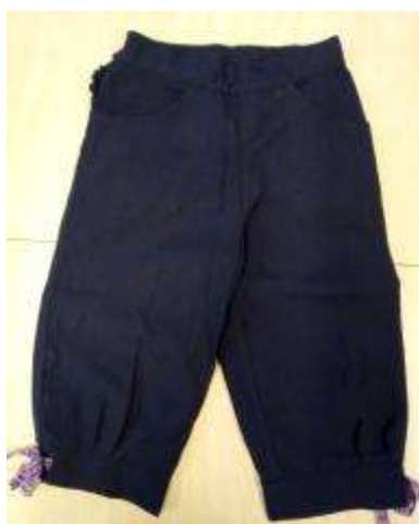
Joonis 11. Põlvpiüksid (Põltsamaa)