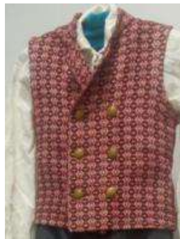
Joonis 3. Vest (kasutati Torma koolis)