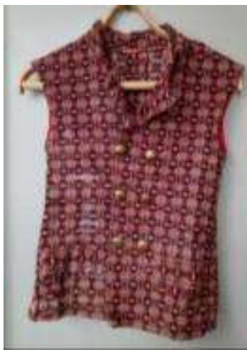
Joonis 2. Vest (kasutati Ulvi v Lohusuu koolis)