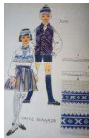
Joonis 27. Jiiri poiss Väike- Maarja tütarlaps