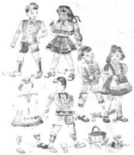
Joonis 61. Lasteriided rahvuslikel motiividel. Eesti Naine 1946. a