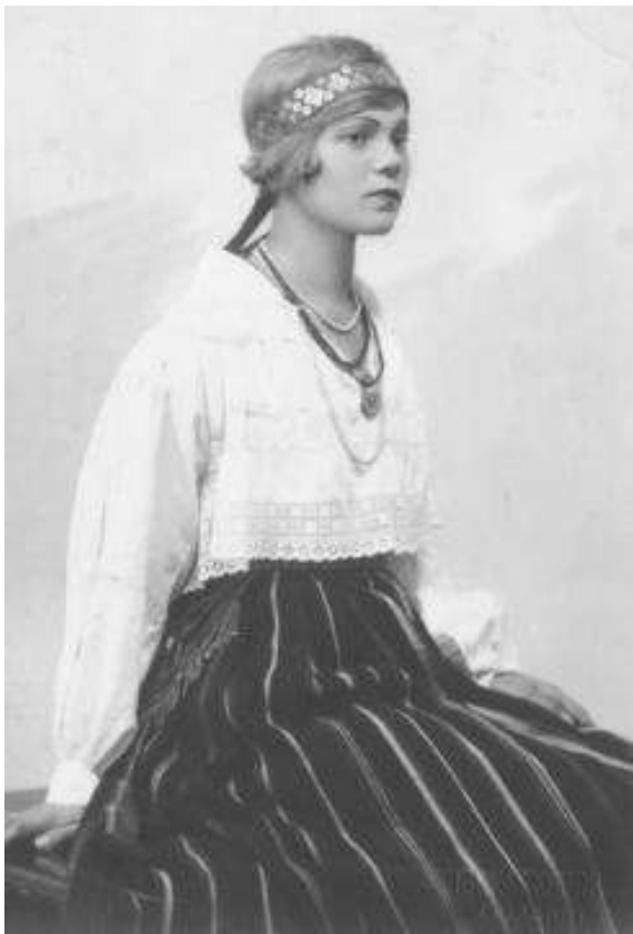
Joonis 13. u 1930.a (A RMF1660:5)