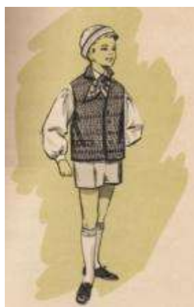
Joonis 21. Jämaja poiss