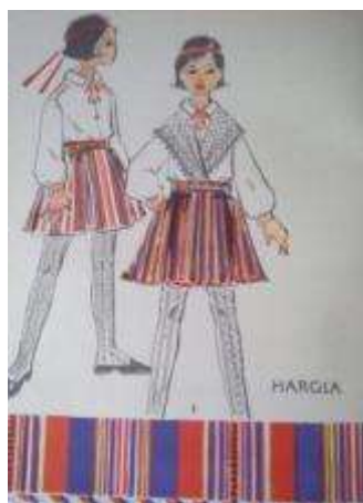
Joonis 26. Hargla tütarlaps