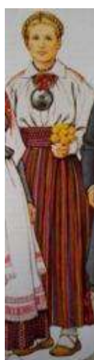
Joonis 60. Otepää neiu