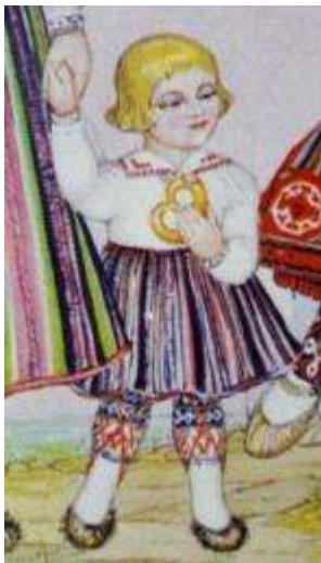
Joonis .1 Kihnu tütarlaps