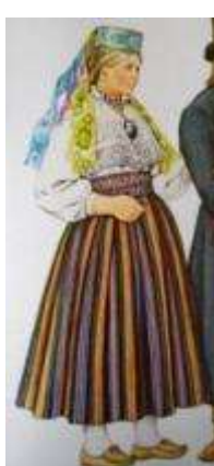
Joonis 53. Viru- Nigula neiu