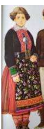
Joonis 54. Muhu neiu