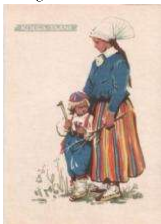
Joonis 5. 1960. a postkaart kunstnik Asta Vendler Erakogu