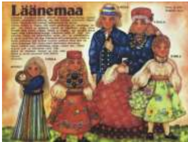
Joonis 13. Läänemaa 1989:4