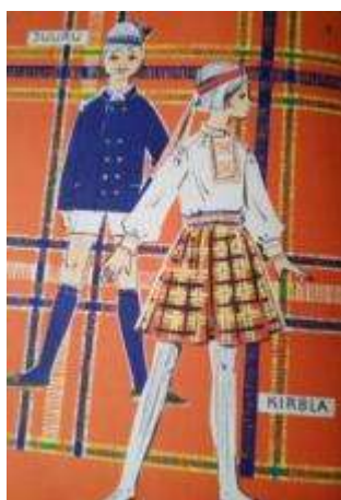
Joonis 29. Juuru poiss Kirbla tütarlaps