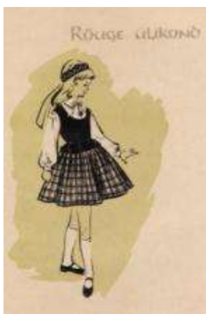
Joonis 19. Rõuge tütarlaps