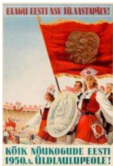
Joonis 2. Plakat 1950. a AM 3225 F 158 2:43