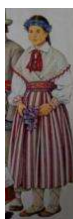
Joonis 56. Hargla neiu