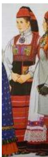
Joonis 57. Anseküla neiu