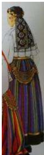
Joonis 59. Pühalepa neiu