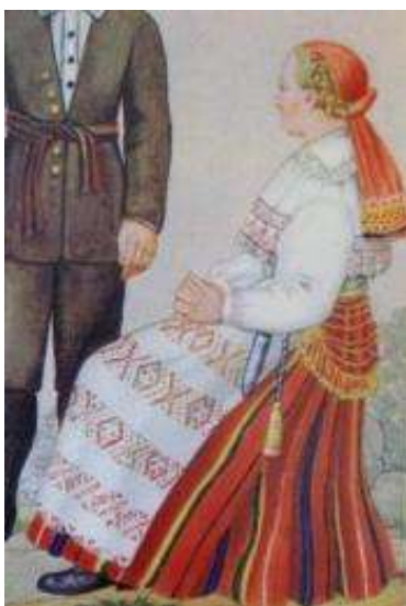
Joonis 4. Pühalepa neiu