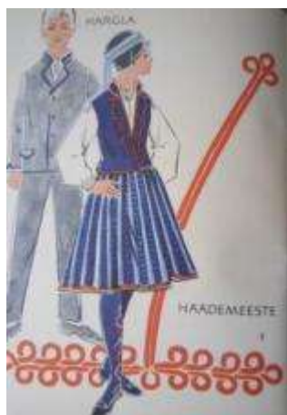
Joonis 25. Hargla noormees Häädemeeste neiu