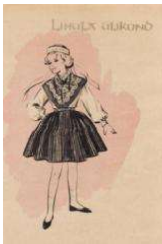
Joonis 17. Lihula tütarlaps