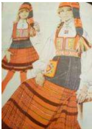
Joonis 32. Anseküla tütarlaps ja neiu