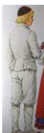
Joonis 55. Torma noormees