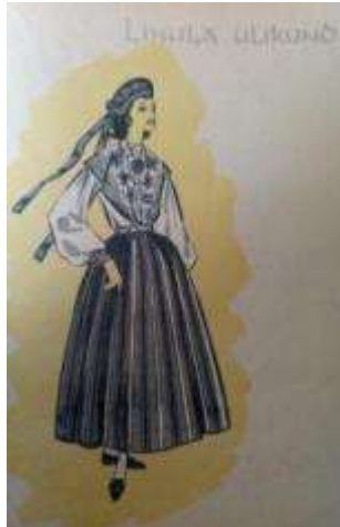
Joonis 23. Lihula neiu