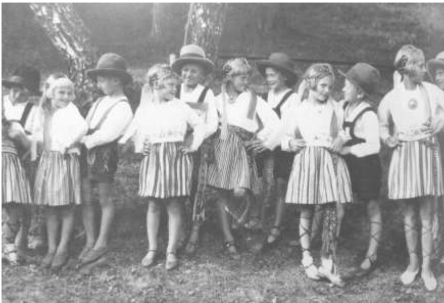
Joonis 18. Väikesed tantsijad u 1920ndatel.

Nende kihelkondade kostüümid olid populaarsed tooteartiklid ARSist tellijate seas. 91 Tellimuste arv kasvas kiiresti ja alguse sai koostöö ERMiga. Kuigi jätkuvalt eelistati tellida saarte kihelkondade rõivad, suudeti tellijaid mõningal määral mõjutada tellima ka oma kodukihelkondade rahvarõivaid.