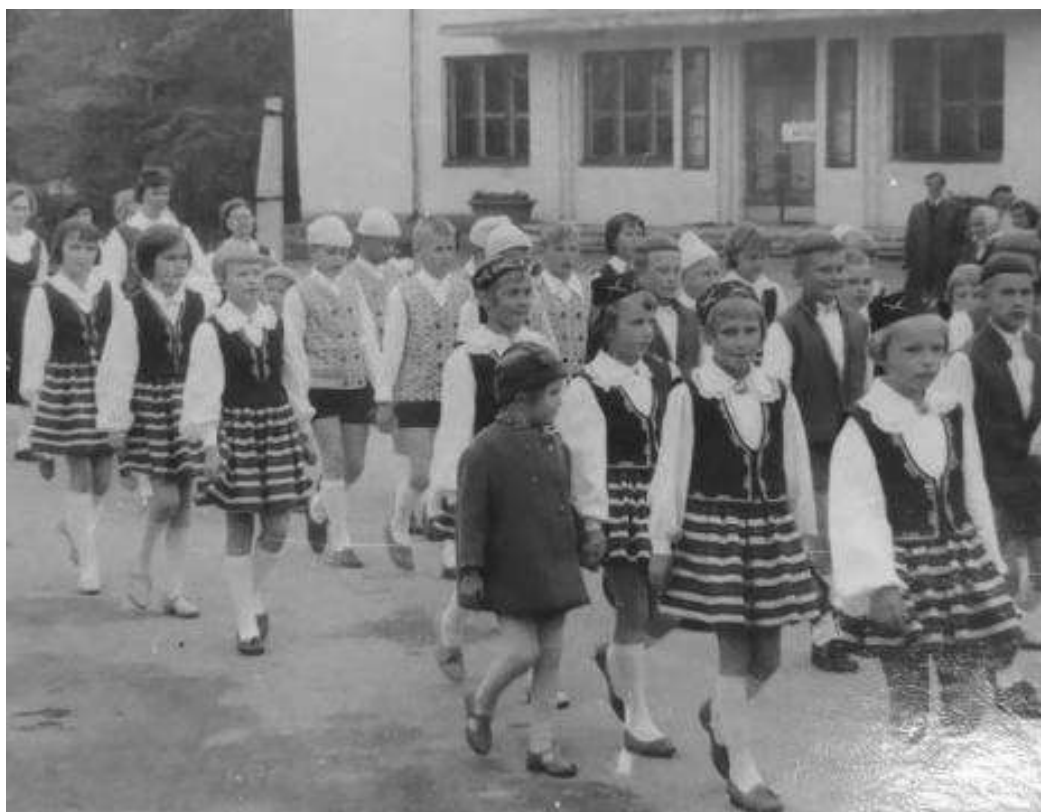
Joonis 18. 1960ndad, rongkäik Põltsamaal (erakogu)