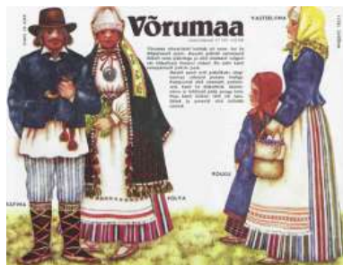
Joonis 20. Võrumaa 1989:11