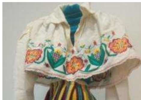
Joonis 9. Käised (Torma kool)