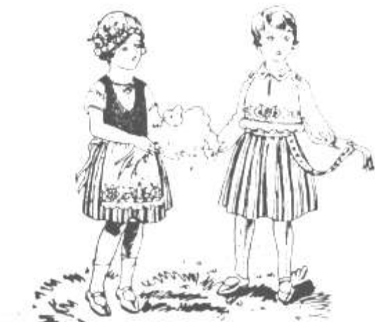
Joonis 59. Kaks rahvariide laadilist kleiti lastele. Eesti Naine 1930.a