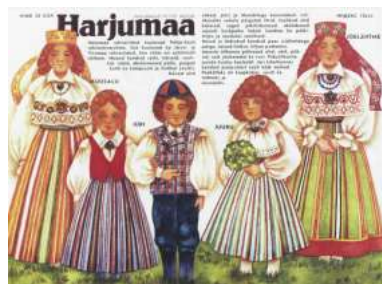
Joonis 14. Harjumaa 1989:5