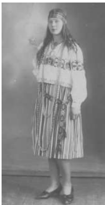
Joonis 9. Neiu stiliseeritud rahvarõivastes u 20. sajandi I pooles (HM F 1659:10 Ff)