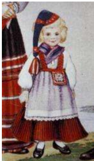
Joonis 2. Kärla tütarlaps