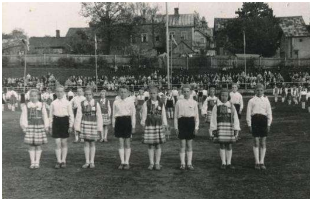
Joonis 20. 1968. a, koolnoorte rahvatantsupidu Rakvere vallimäel. (RM Fn 154:2207)