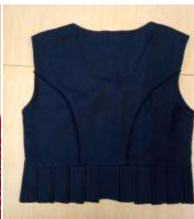
Joonis 14. Liistik (Põltsamaa)