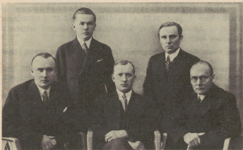
Akadeemilise Ühistegevuse Seltsi praegune juhatus.

Kuigi AÜS haarab oma tegevuspiirkonda pea kõikide teaduskondade huvialasid, on tema liikmete arv siiski võrdlemisi väikseks jäänud. Kuid ka neist on enamik jäänud passiivseks pealtvaatajaks. Aktiivsete liikmete arv on kõikunud 10—20 üm-