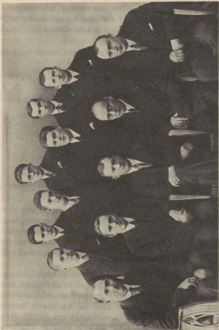
Akadeemilise Ühistegevuse Seltsi praeguse juhatuse- ja toimkondade liikmed.