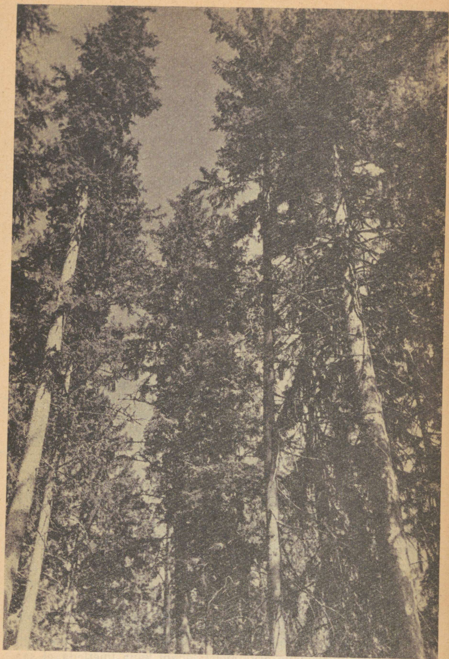
Joon. 2. Uhkelt sirutavad taeva poole võrased hiigelkuused, kv. 224.