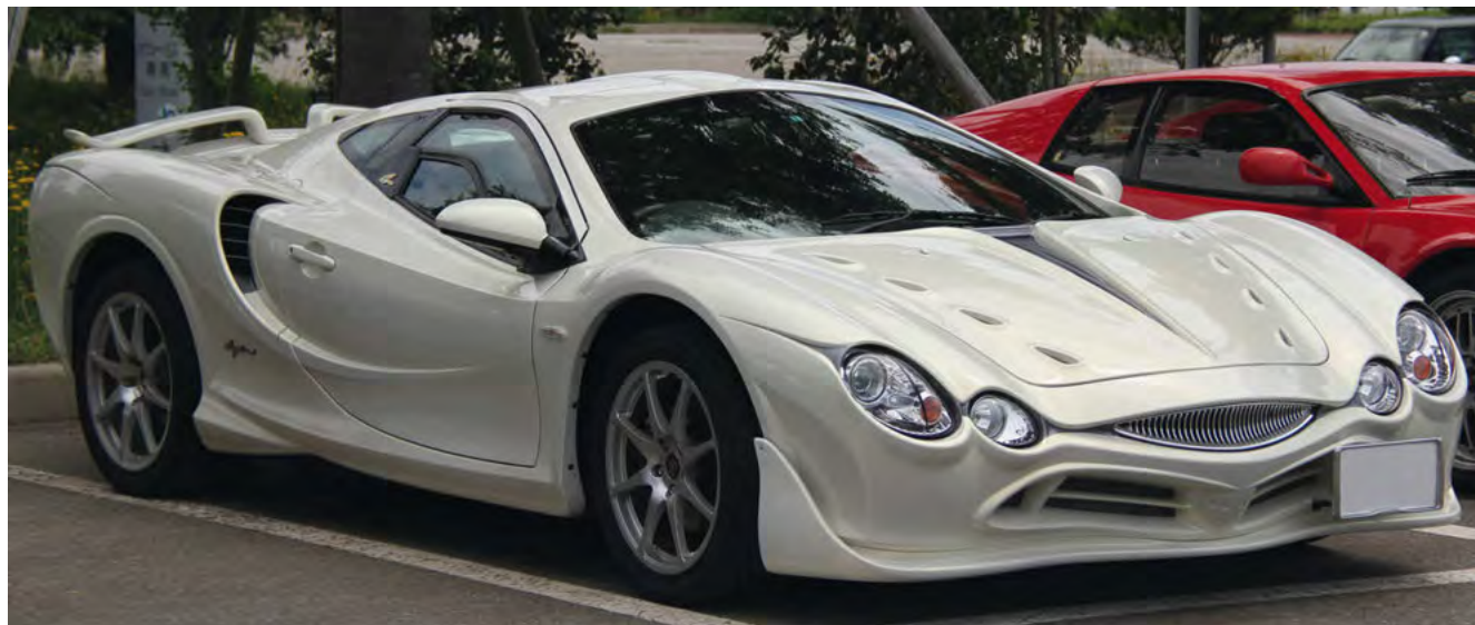
Kõledalt orosi tuulelt nime saanud Jaapani sportauto Mitsuoaka Orochi