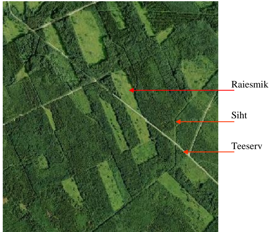
Joonis 1. Tüüpilised avakooslused majandatavas metsamaastikus. Mõõtkava ca 1:20000.

Seega ei ole küsimus mitte ainult selles, kas päevaliblikad suudavad raiesmikele levida, vaid ka selles, kas uute raiesmike asustamine toimub piisavalt kiiresti võrreldes nende kinnikasvamisega ja päevaliblikate jaoks elamiskõlbmatuks muutumisega.