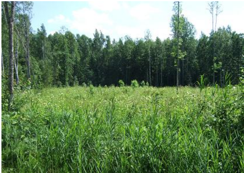
Joonis 4. Näide raiesmikepaarist (ülal eraldatud ja all kontrollraiesmik). Fotod: Tiit Teder.