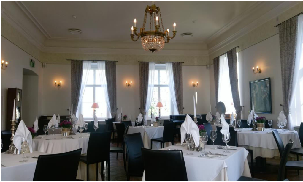
Foto 8. Vihula mõisa restoran La Boheme saal.