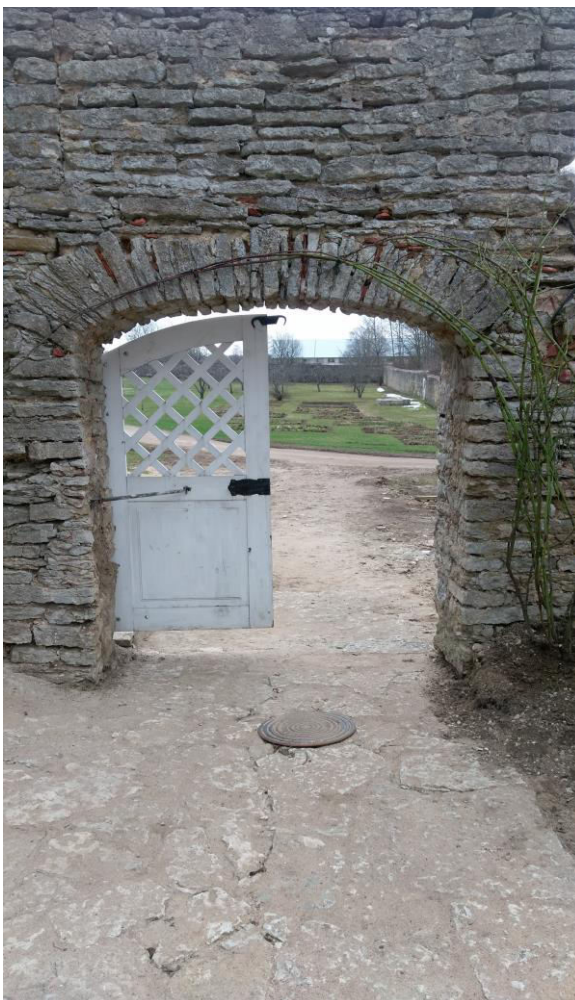
Foto 1. Sissepääs Sagadi mõisa aeda. Foto: Katarina Tomps (17.04.16)