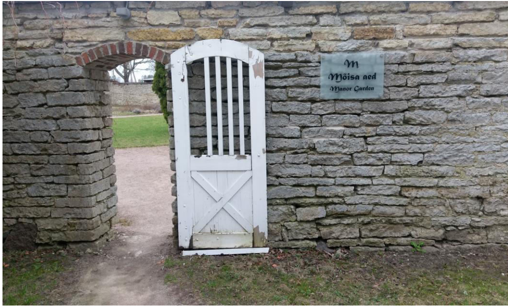
Foto 2. Sissepääs Vihula mõisa aeda. Foto: Katarina Tomps (17.04.16)