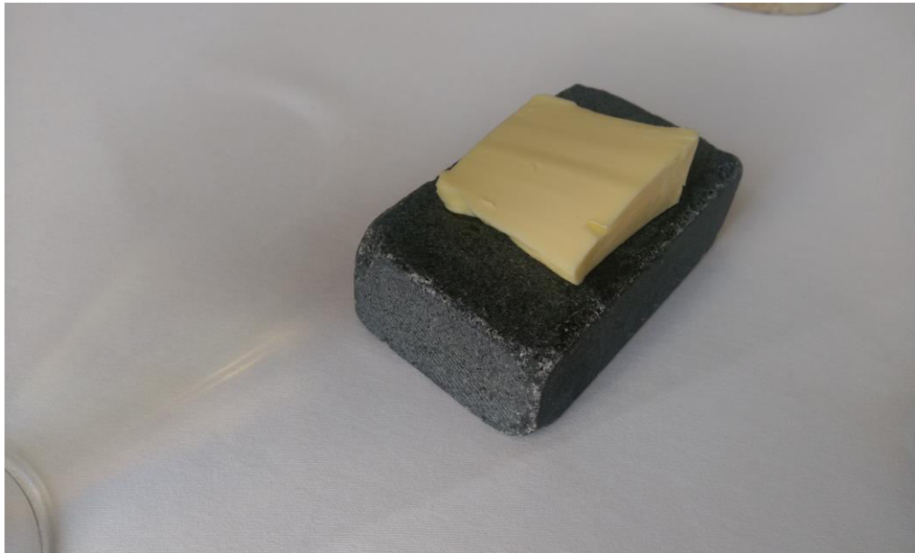
Foto 9. Või külmal kivil serveerituna. Foto: Katarina Tomps (07.05.16)