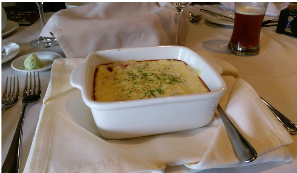
Foto 6. Juustuga üleküpsetatud pelmeenid. Foto: Katarina Tomps (17.04.16)