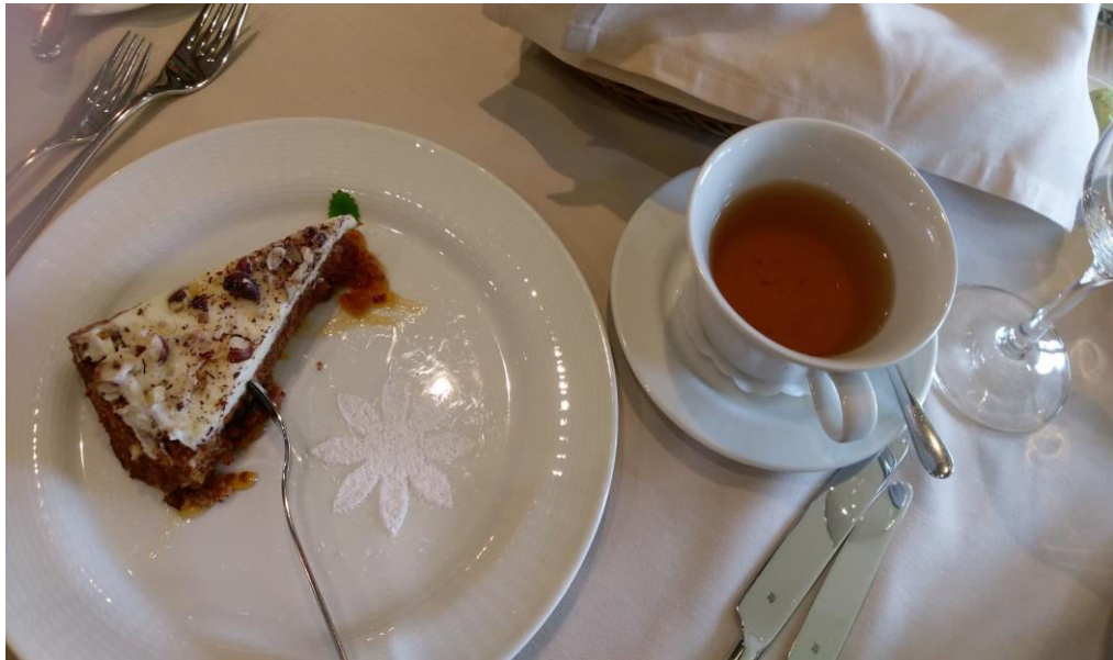
Foto 5. Sagadi porgandikook ja tee. Foto: Katarina Tomps (17.04.16)