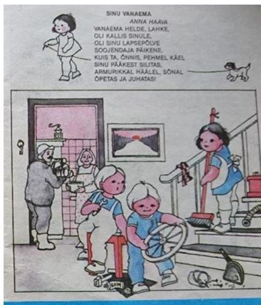
Joonis 5. Näide, kus poistel ja tüdrukutel, meestel ja naistel on soorollidele omased tegevused. Mina teiste seas (Muhel 1992).

Joonisel 4 on näha erinevaid tegevusi, mis on iseloomulikud meestele ja naistele. Vastavalt kodeerimistabelile, mängimine klotside, nukkude vms mänguasjadega on poiste ja tüdrukute protsent suhteliselt võrdne ning seda on näha ka pildilt. Samuti on töötamine koduses majapidamises, suuremaks ülekaaluks naistele mõeldud tegevuses nii protsentuaalselt, kui pildilt nähtavad tegevused, kus naised vannitavad ja hoolitsevad laste eest ning teevad süüa.