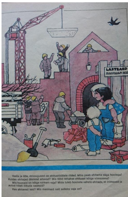
Joonis 3. Näide, kuidas mehed teevad rasket füüsilist tööd. Mina teiste seas (Muhel 1992).

Joonisel 3 on hästi võimalik eristada meessoost ja naissoost isikuid, raske töö ehk ehitustöö tegijateks on mehed ja pealtvaatajateks on lapsed. Tegemist on 1992 aasta õppematerjaliga, mille pealkirjaks on Mina teiste seas ning nagu ta tabelis on võimalik näha, siis sellele ajastule on selgelt omased kindlad soorollid ning nende avaldumine. Antud pildil on selleks, ehitustööd tegevad mehed, mida kaasaegses maailmas on raske ette kujutada, tänu soorollide avatusele on hakanud järjest rohkem naisi töötama meessoost isikutega sarnasel alal.