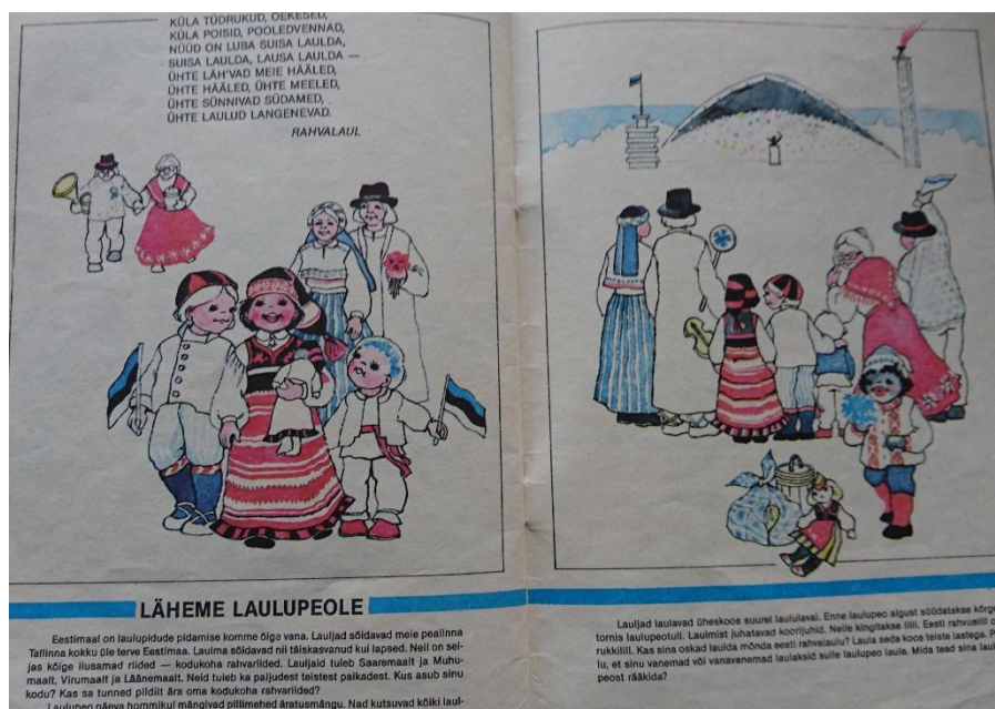
Joonis 6. Näide, isamaalisusest ja laulupeo tegevusest. Mina teiste seas (Muhel 1992).

Joonisel 5 on näha vastavalt soole omaseid stereotüüpe. Meeste peamiseks tegevuseks on töötamine aias, põllul, muu füüsiliselt raske töö, milleks antud joonisel on ahjupuude tupp tassimine. Jooniselt 5 on võimalik märgata ka mängimine sportliku liikumistegevusena, mis on tabeli põhjal samuti meesterahvaste jaoks suuremaks ülekaaluks, võrreldes naistega. Nähtav on töötamine koduses majapidamises (sh koristamine, lemmikloomade eest hoolitsemine jne), mis on tabelis 4. väljatoodud 67% ulatuses naissoost isikute ülekaaluga, sama on märgatav Joonisel 5.