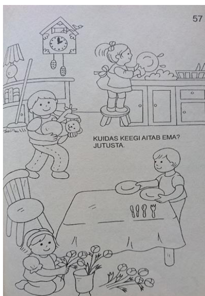
Joonis 2. Näide, et kuidas on kujutatud poiste ja tüdrukute tegevused. Mudilaste töövihik II (Kiis; Olt 2008).

Võrreldes näiteid tööraamatust Simmo ja Sanne ametite maailmas (Joonis 1) ja Mudilaste töövihik II (Joonis 2), võib öelda, et teises õppematerjalis on võimalik naissugu ja meessugu kergemini määrata kui esimeses materjalis. Lastealapse tasandilt mõeldes on kergem märgata sootunnuseid Jooniselt 2, kus tüdrukud ja poisid on oma välimuselt selgelt eristatud aga ka selgelt eristatavad riided ja soengud. Joonisel 1 on samuti arusaadav, kuid seda täiskasvanud inimestele, kes suudavad juba näojooni eristada, mida lastel on keerulisem teha.