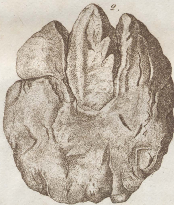
Chirotherium minus Kaup