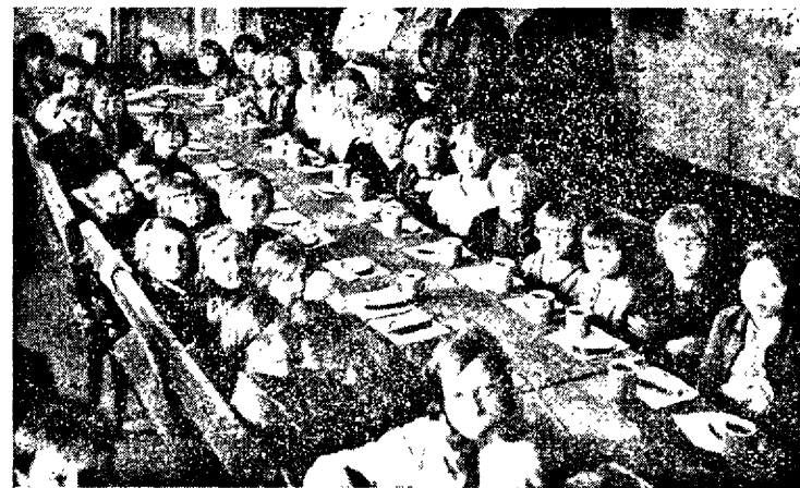
Воскресная школа за завтракомъ.

Дѣти прежде всего требуютъ отъ насъ духовной помощи. Съ ними надо работать тѣмъ, кто думаетъ о будущемъ.