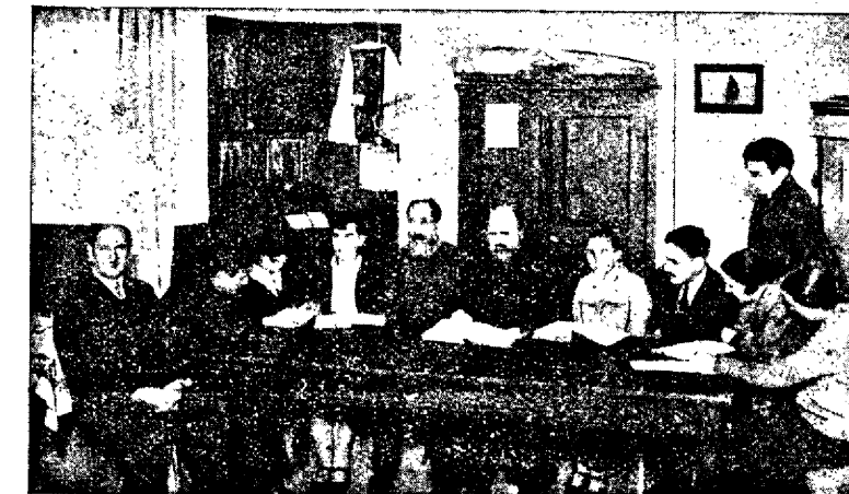
Евангельскій кружокъ подъ руководств. батюшки.