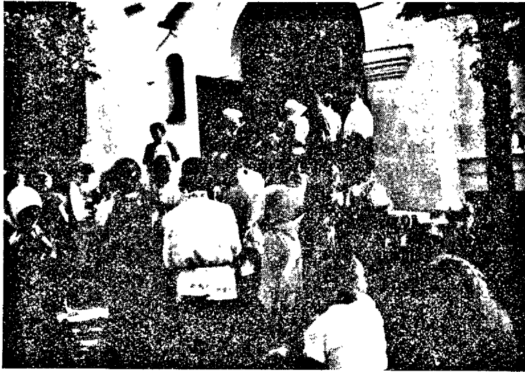
Изъ церкви на занятія.

Въ деревнѣ идетъ работа по кружкамъ — евангелискимъ, литературнымъ. Каждый годъ устраиваются районные религ.-культурные съѣзды, делегатскіе съѣзды, курсы. Въ Движеніе вошли лучшіе представители крестьянской молодежи Ирборскаго, Шумилкинскаго, Декшинскаго, Кулейскаго и др. районовъ.