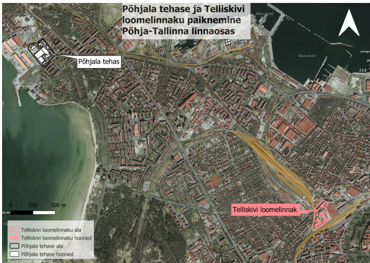
Joonis 3. Põhjala tehase ja Telliskivi loomelinnaku paiknemine Põhja-Tallinna linnaosas.

Tallinnas on taas elustatud endiseid tööstuspiirkondi ja nendest kujundatud loomekeskkondi peamiselt Põhja-Tallinnas, aga ka mujal, näiteks Ülemiste piirkonnas. Nii on Tallinnas kujunenud loomeettevõtete asumiteks endine Kalinini tehase Telliskivi tänaval ja Põhjala kummikutehas Koplipoolsaarel (joonis 3). Mõlemal piirkonnal on tänapäevaseks kujunemisel oma lugu, mis on tingitud nii üldisest majanduslikust olukorrast kui era- ja avaliku sektori koostööst.