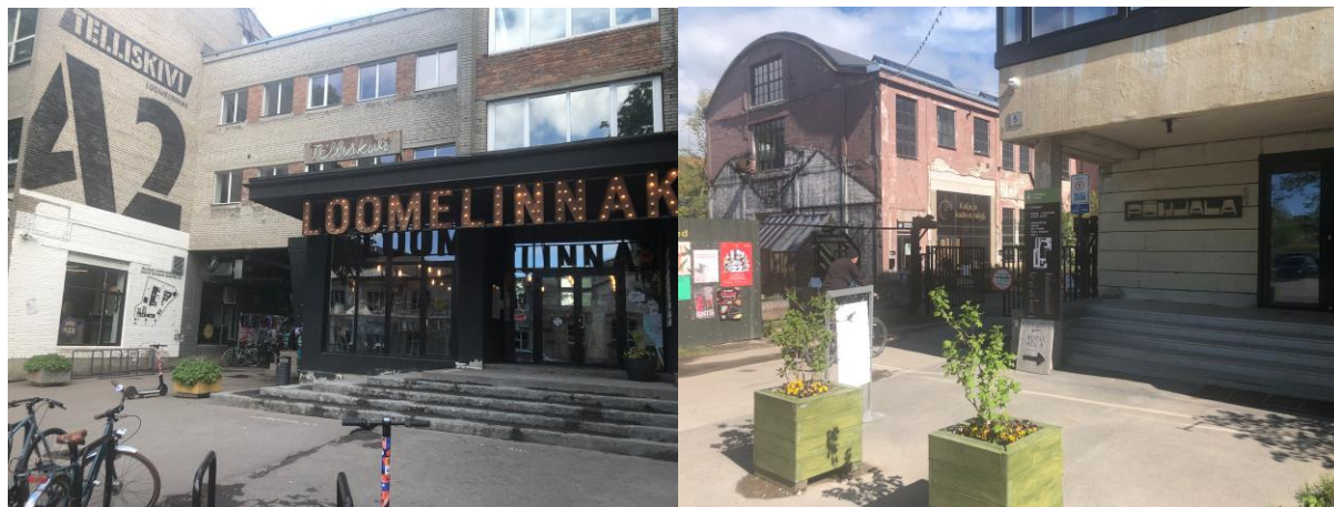
Joonis 4 ja 5. Telliskivi Loomelinnaku ja Põhjala tehase sissepääsud

Põhjala tehas toimis kuni 1998. aastani kummitehasena, mis andis tippajal 1970. aastate lõpus tööd 700-le inimesele. Alates 2019. aastast on tehase territooriumil hakatud korraldama erinevaid kultuuriüritusi ja arendama loomemajanduse kogukonda. Viimase paari aastaga on endale koha leidnud üle 50 ettevõtte, kellest enamus tegeleb disaini, kunsti, meelelahutuse või mõne teise loometegevusega.