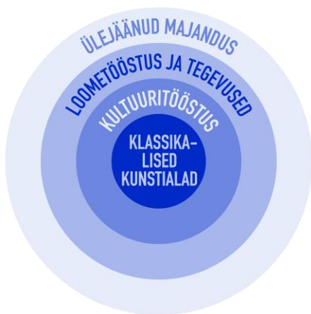
Joonis 1: Loometööstuse suhestumine majanduse ja kunsti valdkondadega (Kultuuriministeerium, 2007)

Eestis peetakse loomeettevõteteks kooslust erineva tausta ja oskustega inimestest, mille keskmes on küll loovisik, kuid toote või teenuse tarbijani viimiseks on vaja toetavat süsteemi, toote või teenuse levitajaid ja turundajaid (Konjunkturiinstituut, 2018). Loomemajanduse baasi moodustavad klassikalised kunstialad ( core creative fields ), millest kasvab välja kultuuritooteid loov kultuuritööstus ( cultural industries ). Need alamsektorid koondab enda alla loometööstus üldiselt ( creative industries ) ja seob kokku ülejäänud ettevõtlusharude ja nende vajadustega (joonis 1). Loomeettevõtete roll on seda suurem, mida rohkem teised majandusharud nende tooteid ja teenuseid konkurentsivõime tõstmisel kasutavad (Kultuuriministeerium, 2007). Eestis oli 2015. aasta seisuga loomemajanduses hõivatud 30700 töötajat ja loomeettevõtted andsid kokku 1,5 miljardit eurot. See on 4,8% kogu riigi töötavast rahvastikust ning 2,8% kõikide ettevõtete müügitulust. Keskmise töötajate arv loomemajanduse ettevõtetes oli 3,4 inimest (Konjunkturiinstituut, 2018).